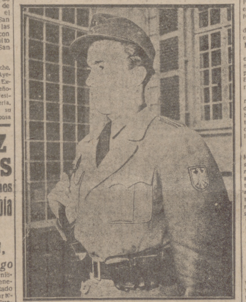
Un policía alemán de fronteras, de los que prestan vigilancia en el Palacio Schaumburg, centro político de la República Federal Alemana en Bonn, luce sobre su nuevo uniforme su también nuevo escudo distintivo.