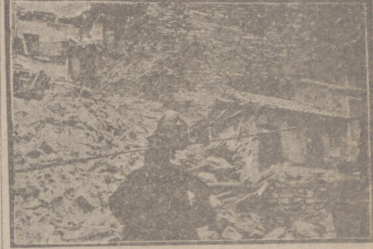
Las impresionantes fotografías de la tragedia que anteayer causó la muerte en Astorga a una madre y sus cuatro hijos al derrumbarse parte de las antiguas murallas, consideradas como monumento nacional. Hasta ahora sólo ha sido extraído un cadáver de entre las toneladas de piedras que cayeron sobre varias casas del popular barrio de San Andrés, cinco de las cuales quedaron destruidas por completo. La parte derruida de la muralla media 20 metros de ancho por 15 de alto.