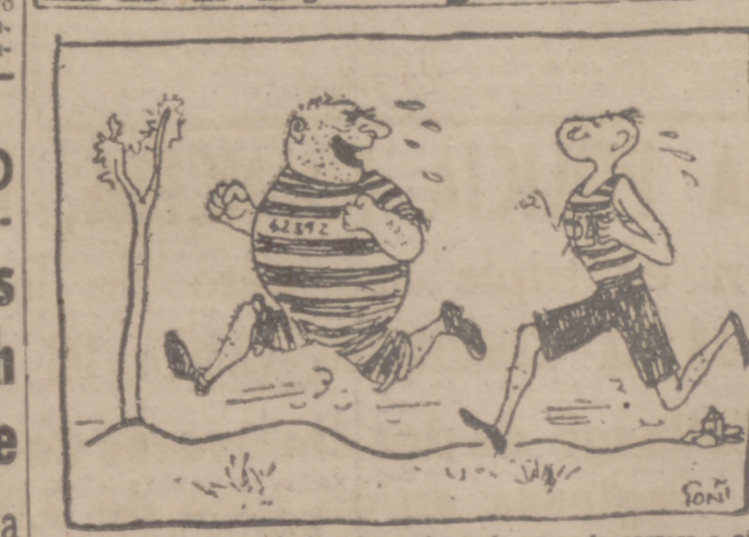
Realmente, nada hay tan estupendo como la carrera a pie.

Se cuenta la siguiente anécdota del senador norteamericano Louis Stevenson: Certo día, al salir del Senado, donde había tenido un fuerte debate que le produjo indignación, un ujier le oyó decir al abandonar la sala, en voz baja y como reprochándole el mal humor que le habían producido sus compañeros: —Ahora me voy a casa a cenar. Si la cena está lista, no la comere. Y si no está preparada, armaré un infierno a mi mujer.