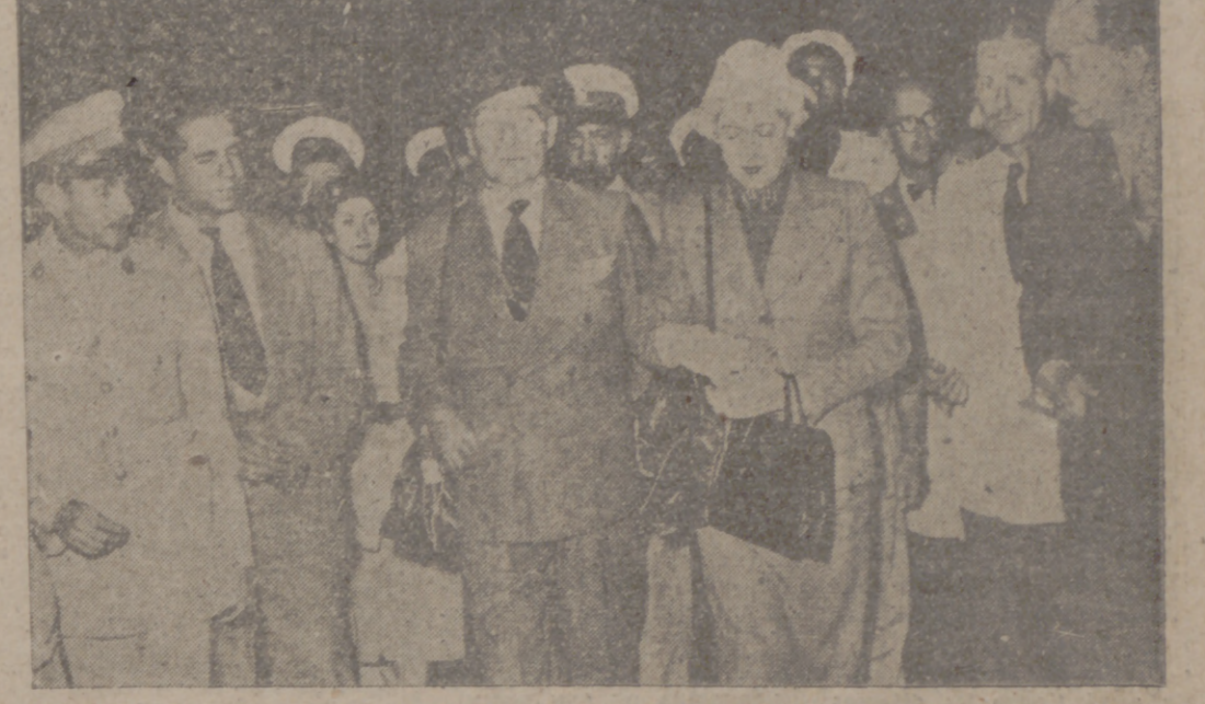
La abdicación forzosa de Faruk sorprendió al embajador inglés en El Cairo, veraneando en Londres, donde se hallaba pasando las vacaciones. El embajador hubo de suspender el descanso y regresar a su puesto. Aquí vemos a Mr. Stevenson y su esposa al llegar a la capital egipcia, con la cara de circunstancias correspondiente.