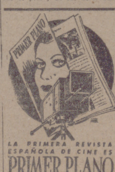
LA PRIMERA REVISTA ESPAÑOLA DE CINE ES PRIMER PLANO