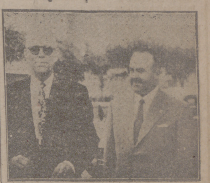
LÁ CORUÑA.—El embajador de Cuba, doctor don Antonio Irazoz de Villar, momentos después de su llegada a esta ciudad.

"Traigo, dijo, un mensaje del presidente Batista para el pueblo español y un voto de gratitud para el Caudillo"