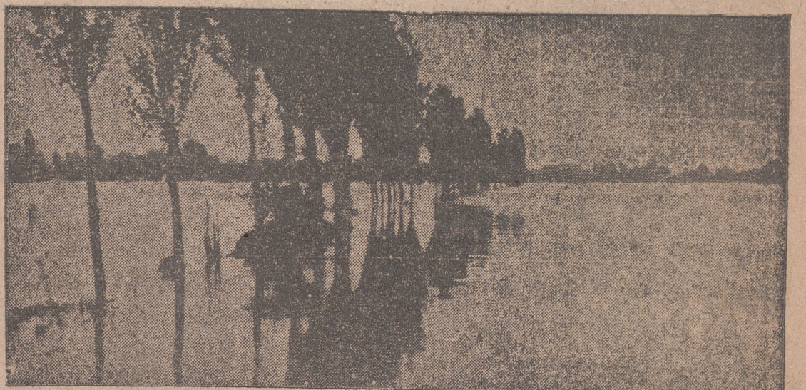
TUDELA.—Un aspecto de las aguas desbordadas del Ebro, que inundaron la carretera de Valtierra a Milagro. A causa del temporal de lluvias, el nivel de dicho río alcanzó cuatro metros sobre el normal.