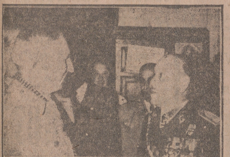
El embajador de Estados Unidos conversando con nuestro capitán general, excelentísimo señor don Emilio Esteban Infantes, antes de comenzar el sermón de las Siete Palabras.

Invitado por el Excmo. Ayuntamiento de Valladolid y por la Junta de Fomento de la Semana Santa, el pasado jueves llegó a nuestra ciudad el embajador de Estados Unidos en España, mister Lion MacNeigh, con el fin de presenciar el desfile procesional de la Pasión de Jesús.