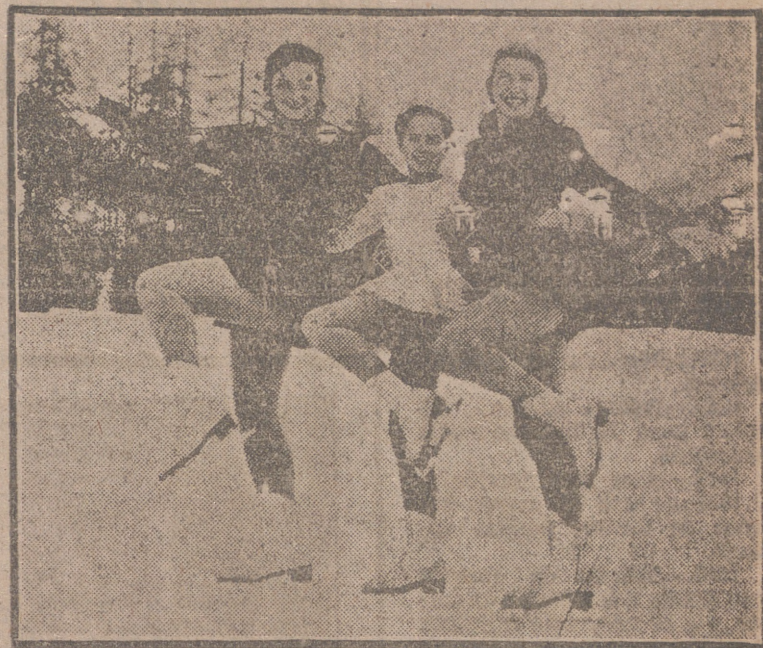
Jeanette Altwegg, inglesa campeona mundial de patinaje artístico; también británica Yvonne Sugden, que es la más joven de su equipo; y la australiana Nancy Italian, entrenándose ante los Juegos Olímpicos de Invierno.