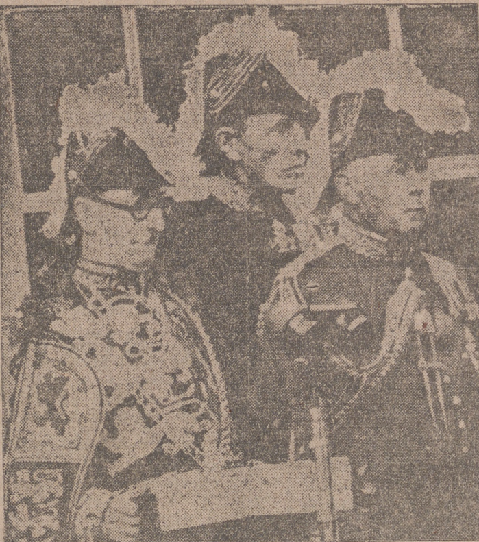
Londres.—Los altos dignatarios de la Corte proceden a la lectura de la proclamación de Isabel II, reina de Inglaterra, en el balcón del Palacio de San Jaime.