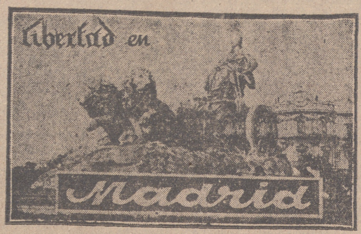
Libertad en Madrid

Tras de la noticia facilitada hace días por el ministro de Obras Públicas, conde de Valleliano, anunciando que en breve serán reincorporados al servicio cien agentes de la Renfe que fueron separados como consecuencia de la depuración política-social que hubo de efectuarse a raíz de la liberación, el Sindicato del Transporte se preocupa de obtener igual medida de generosidad para los que pertenecieron a las Compañías de los ferrocarriles explotados por el Estado, coches-camas, Metropolitan madrileño, Tranvías y Compañía Telefónica. En todos estos centros de trabajo se están tramitando los necesarios expedientes de revisión. Los empleados y obreros telefónicos dependen también —aparte su co-