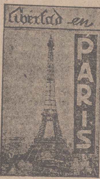
Libertad en PARIS

Tragedia en la zona petrolífera de Lacq Si no hay éxito, habrá que evacuar varios pueblos e incendiar los pozos