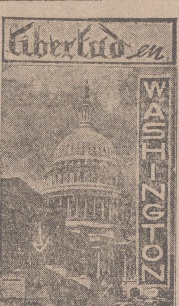
Washington, febrero. (Servicio especial de crónicas "Amunco") El anuncio de que cien millones de dólares serán empleados por el Gobierno norteamericano en una nueva campaña de la "guerra psicológica"...