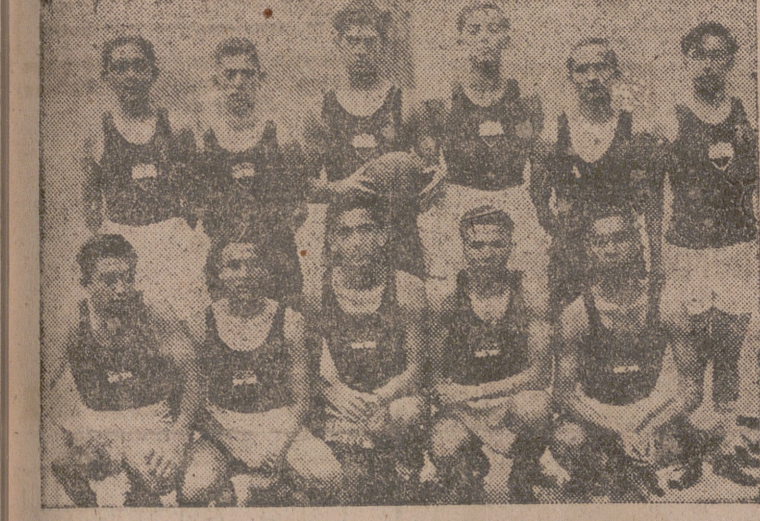
Equipo del Colegio de Lourdes "Atómico"

A las cuatro y media de la tarde contendieron en la Congregación Mariana de Luisles los equipos del Jaque Club y de los Luisles. Sorteados los colores de piezas, corresponde llevarse blancas a los congregantes en los tableros 1 y 3, y por tanto, negras en los números 2 y 4.