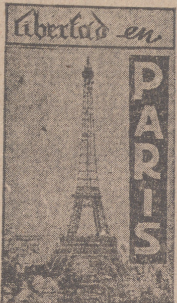
Paris. (Crónica del enviado especial de "Pyresa", ISMAEL HERRERA.)

La generosidad de FRANCO mantiene la puerta abierta para los que quieren volver a la Patria