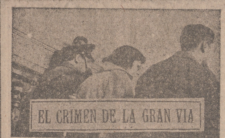
EL CRIMEN DE LA GRAN VIA

París, 29.—Por 24 votos contra 9 —es decir, por mayoría superior a la necesaria en el Pleno de las dos terceras partes— y con 25 abstenciones, la Comisión Política Principal de la Asamblea General de las Naciones Unidas ha declarado a Rusia culpable de haber roto su tratado de amistad con la China nacionalista.—Efe.