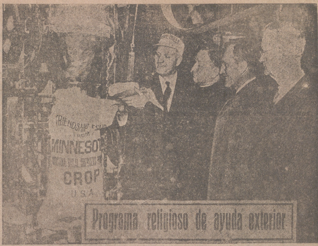
Programa religioso de ayuda exterior

Una de las organizaciones benéficas existentes en los Estados Unidos es la CROP, cuyo nombre está formado por las iniciales de "Christian Rural Overseas Program", o sea Programa Exterior Rural Cristiano. Es un programa religioso en acción, una expresión de amistad de los norteamericanos hacia las naciones de Europa Central, Italia, Grecia, Israel, Turquía, India, Japón, los países árabes, etcétera. Está patrocinado y dirigido por católicos y protestantes.