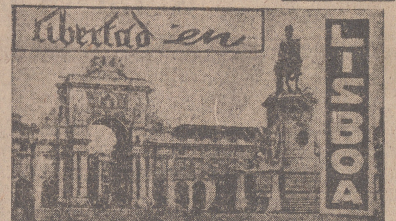
Lisboa. (Crónica de nuestro corresponsal, ADOLFO LIZON).

LUTO y LAGRIMAS en la costa portuguesa Decenas de tripulaciones, amenazadas por un furioso temporal La sencillez de un héroe mariner