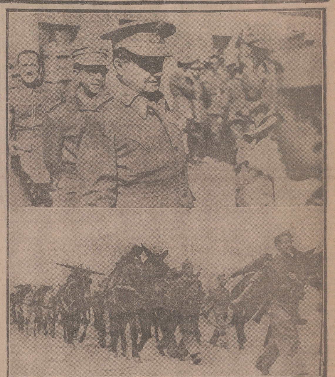
Las maniobras de Ferral, a once kilómetros de León, han servido para confirmar la preparación, el espíritu y temple de las fuerzas de la VII Región, bajo el mando del excelentísimo señor don Maximino Bartomeu, que aparece en la "foto" conversando con sus soldados. En la segunda, un momento del marcial desfile con que terminaron las maniobras.