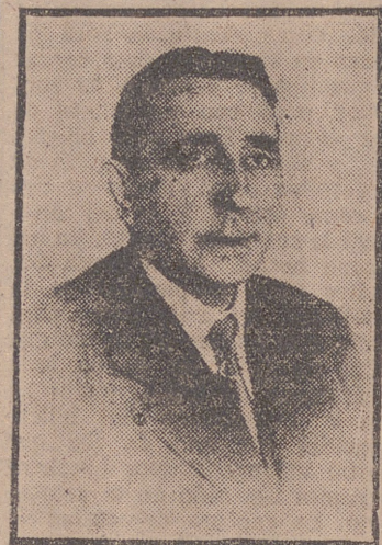
MANUEL MARTIN SAN MARTIN, Alcalde de Olmedo.