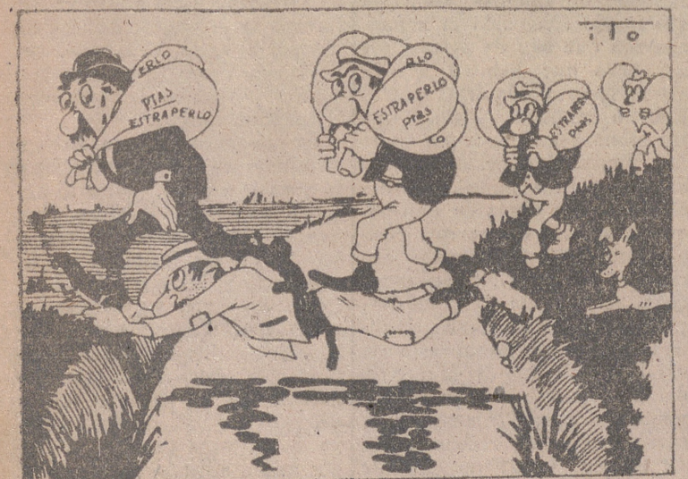
EL TRASIEGO DE LA AVARICIA.—(Por ITO). Juan Español: —¡Pero bueno, a ver cuándo se cansan de pasar por encima de mí! ¿O es que les parece todavía poco aguante?

Salvo mejor opinión del señor Ruvosa de Perari.