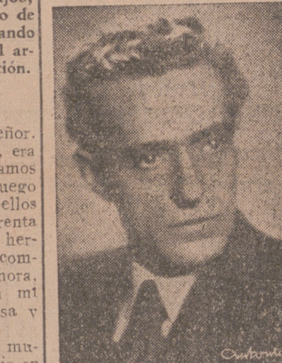
«Genio y figura...»

«pista» segura y en ella estoy, sabe Dios si hasta esclarecer el final. Contento, ufano y, como siempre, dispuesto a ser el Ramper que el público quiere que sea. Y lo será hasta que Dios y ellos quieran. En volandas sobre sus brazos me llevan y en volandas voy y vengo, me iré y volveré para entregar cuanto poseo al público. De él es mi arte, y en paz.