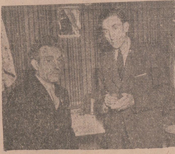
Ramper al habla con ITO

Pocos artistas gozan de tanta admiración pública como Ramper, el genial Ramper. Antes, en las tablas, entre bambalinas y tras la luz agresiva del foco y de las candelillas, y ahora—como tiempo ha—en la pista del circo, Ramper sostiene un crédito ilimitado por el caudal fabuloso de su arte, caudal sólo comparable en valor de otra tasa al de uno de esos maharajas que citan los cuentos de fantasía e ilusión. No exagero ni tanto así. Cuarenta años dándole al manubrio de la gracia, cuarenta años sobre el mismo nivel, cuarenta años siendo Ramper, el Ramper de hace cuarenta años, el de veinte, el de cinco y el de hoy, el de ahora mismo, el que vemos diariamente, ágil de entusiasmos, frenético de ilusiones y «triumfador» como un «Manolete», no es ser una cosa artística ni de clase media, ni de clase primera; es ser de la clase especial.