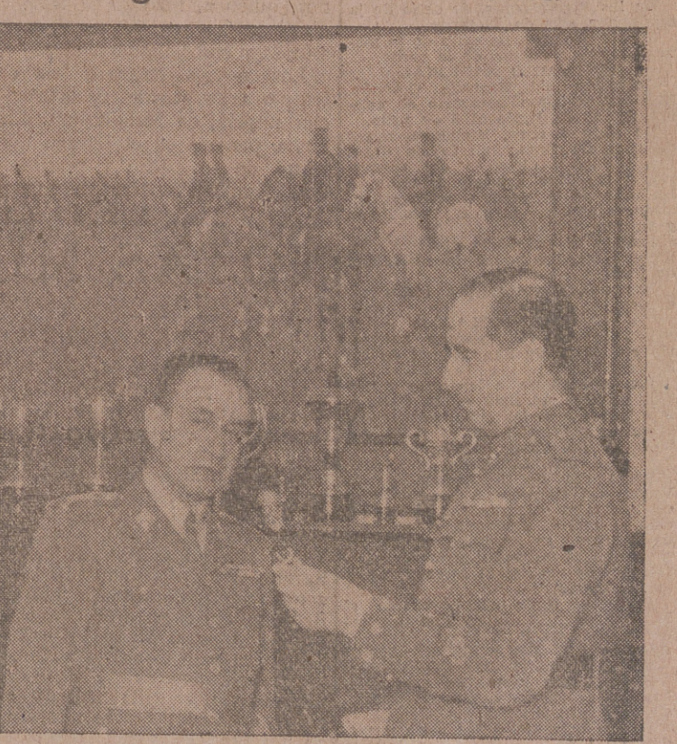
UN MOMENTO DEL ACTO