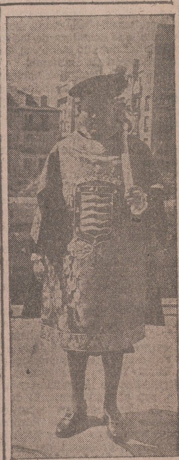
Nuevas dalmáticas de los maceros de nuestro Ayuntamiento.

Esta conclusión fué aprobada por aclamación. Seguidamente, los presidentes de las comisiones nombradas al efecto expusieron sus proyectos de conclusión y se entabló una discusión en la que intervinieron los delegados de diferentes países. El Pleno acordó enviar de nuevo a las comisiones primera y tercera sus proyectos de conclusiones para que sean redactados de acuerdo con las indicaciones hechas por los congresistas y que fueron aprobadas. La sesión se levantó cerca de las dos de la tarde.—Cifra.