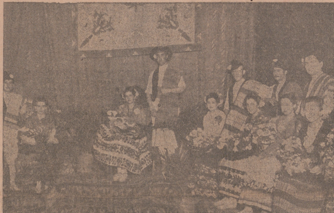
A beneficio de los damnificados por las inundaciones, la colonia murciana de Valladolid celebró ayer una velada artística en el Teatro Calderón. (Lea información en la página quinta.)