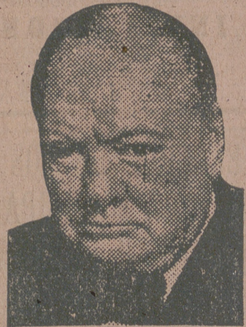
Blum llega a Washington

Washington, 16.—La Cámara de Representantes ha acordado prolongar por nueve meses la autorización de los poderes de tiempo de guerra al Gobierno, inclusive la autoridad para fijar el racionamiento y las propiedades que de otro modo expirarían el 30 de julio próximo. Ha prorrogado también por doce meses la autoridad para