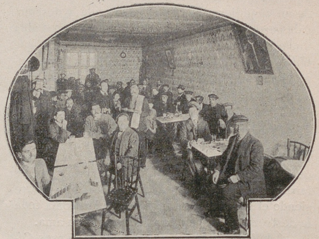
Vista parcial del café