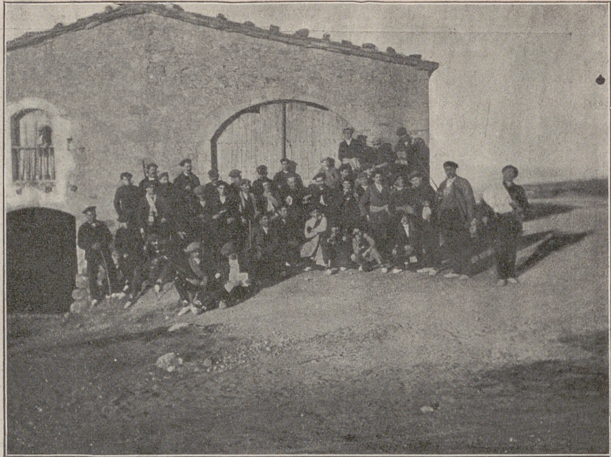
Grupo de jóvenes traaditionalistas manresanos en una excursión que realizaron el 19 de Noviembre

A las siete llegó á Manresa la expedición, rebosando todos de alegría y entusiasmo por el fruto de aquella bien aprovechada tarde.