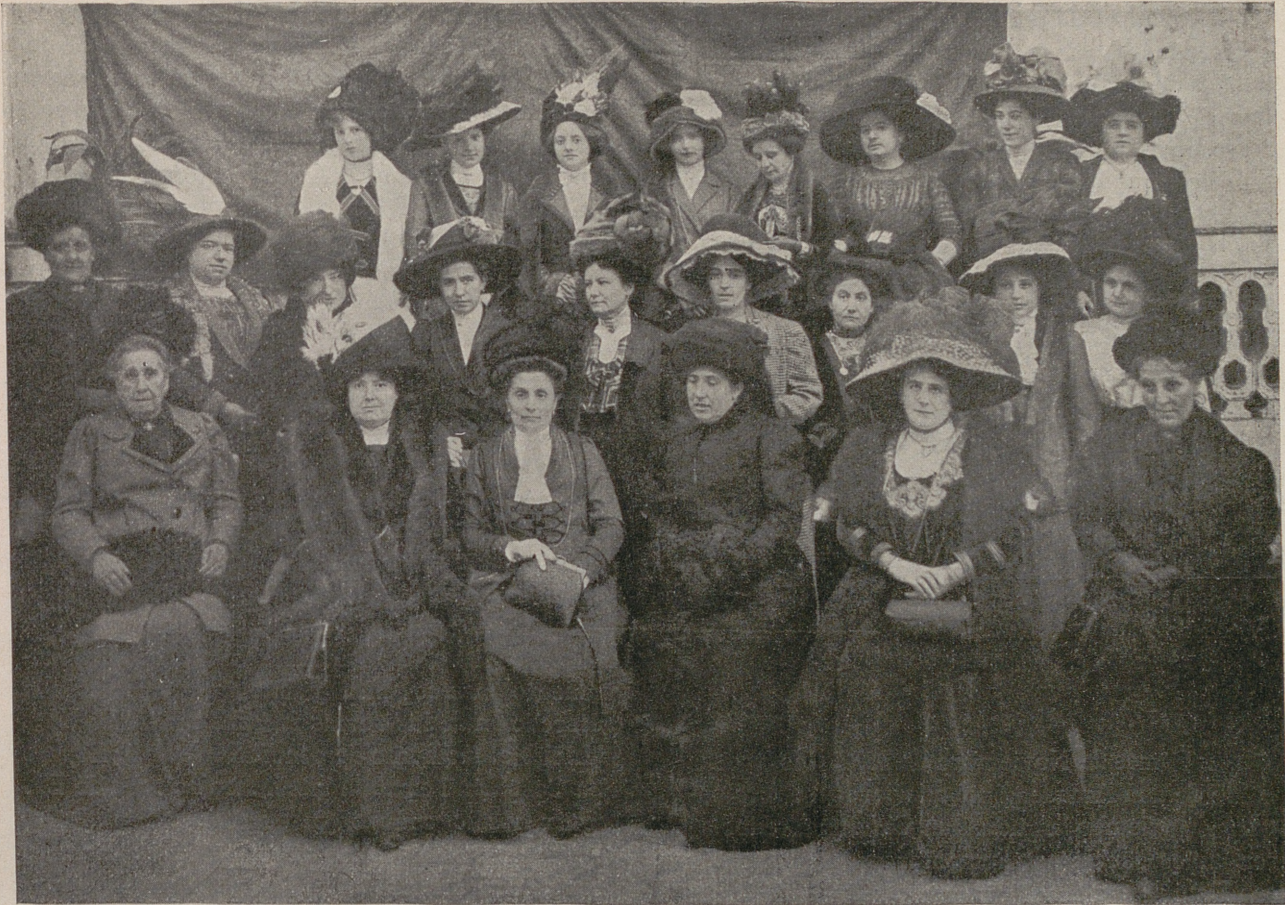
Sras. socias de la Conferencia de Nuestra Señora de Montserrat

Y A que estamos consagrando nuestras páginas á hablar de las sociedades jaimistas tenemos que traer á un puesto de honor á una de las más sublimes de entre ellas.