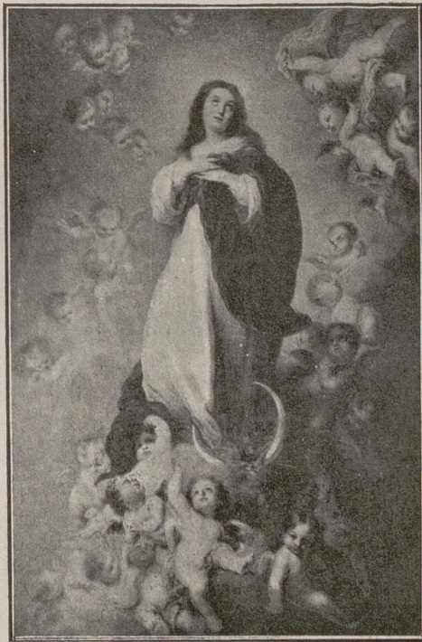
María Inmaculada, Patrona de España y de los periodistas católicos

Bien sabía Adán que había incurrido en la pena de muerte eterna. Mas, antes de oír la sentencia pública y solemnemente de su condenación quiso Dios benigno manifestarle todo el poder de su sabiduría y de su misericordia, y volviéndose á la serpiente, « Maldita eres, le dijo, entre todos los animales de la tierra; enemistades pondré entre ti y la mujer, ella quebrantará tu cabeza. » ¡Qué sentencia tan admirable! ¡Qué misterios tan sublimes se encierran en ella! Descubre Dios á la serpiente que habrá una mujer á quien no ha tocado su veneno, cuya mano sacará á su propio