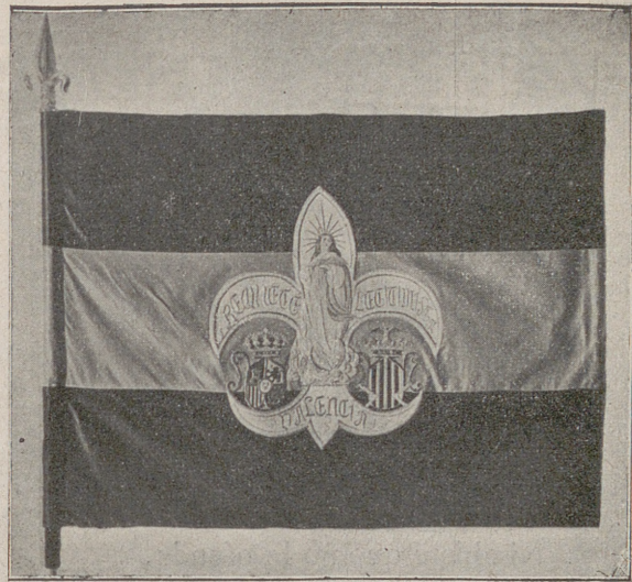
Bandera del Requeté Jaimita