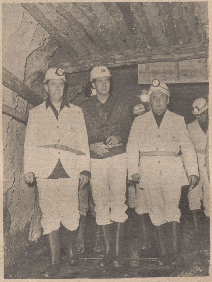
ALMADEN.— El Príncipe de España, don Juan Carlos de Borbón, acompañado por el Ministro de Hacienda, visitó Almadén, bajando al Pozo de San Teodoro, en las minas de mercurio de esta ciudad. El príncipe, además de recorrer las instalaciones, departió cordialmente con los mineros.

Según declaraciones del ministro francés del "Equipement"