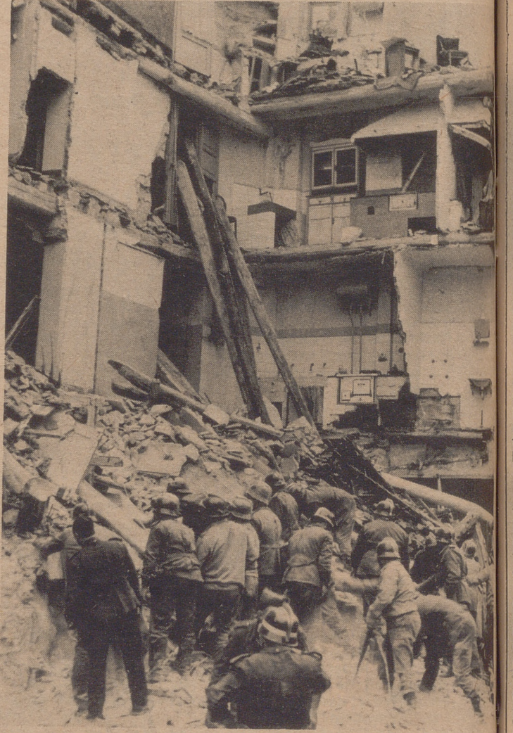
Al principio acudió una veintena de bomberos. Pero fueron llegando también los que estaban francos de servicio y los equipos que habían actuado en Gallur. A última hora de la tarde, había casi cincuenta hombres trabajando bajo los focos.

Me comentaron el gran peligro con que sus hombres desarrollaron los trabajos de