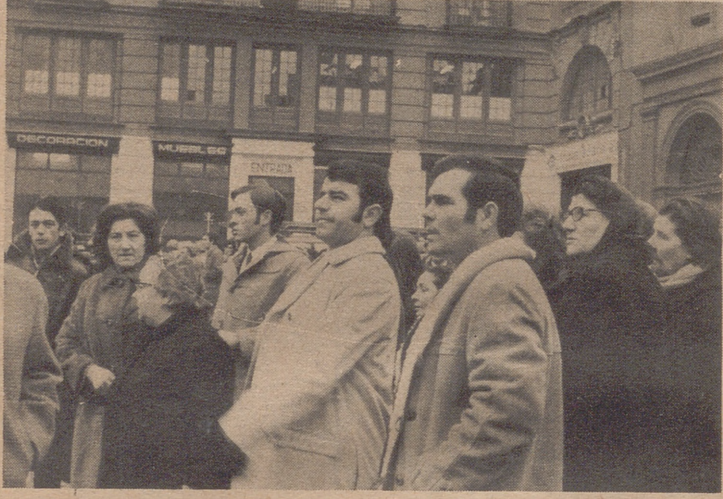
Esta mañana continuaba la expectación en la calle de Ramón y Cajal. Numerosos viandantes se detenían para observar los últimos trabajos de los bomberos y el estado en que ha quedado la casa derrumbada.

hablaremos todo lo que quieran. Pero, por favor, dñese la mayor prisa que puedan. Estamos rendidos y queremos irnos a cenar.