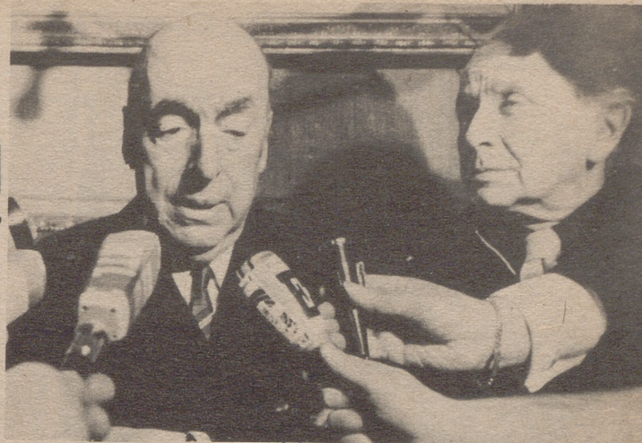
PARIS.— El embajador de Chile en París, el poeta Pablo Neruda, que ha sido galardonado con el premio Nóbel de Literatura.

● "LOS POETAS PRIMERO NOS ENAMORAMOS DE NOSOTROS MISMOS, LUEGO DE TODAS LAS MUJERES, LUEGO DE UNA SOLO..." DECIA EL NUEVO NOBEL