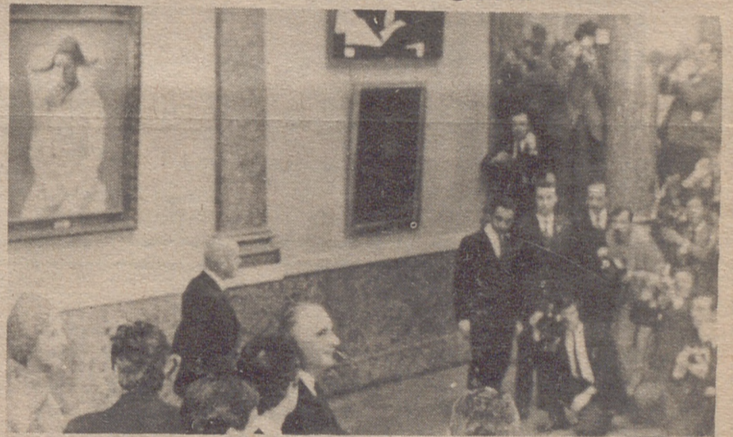
PARIS.— El presidente Georges Pompidou y su esposa asisten en el museo de Louvre a la inauguración de la exposición de obras de Picasso, con motivo del 90 cumpleaños del famoso pintor. Es la primera vez que un pintor expone en dicho museo francés.

● POMPIDOU EN LA EXPOSICION PICASSO EN EL LOUVRE