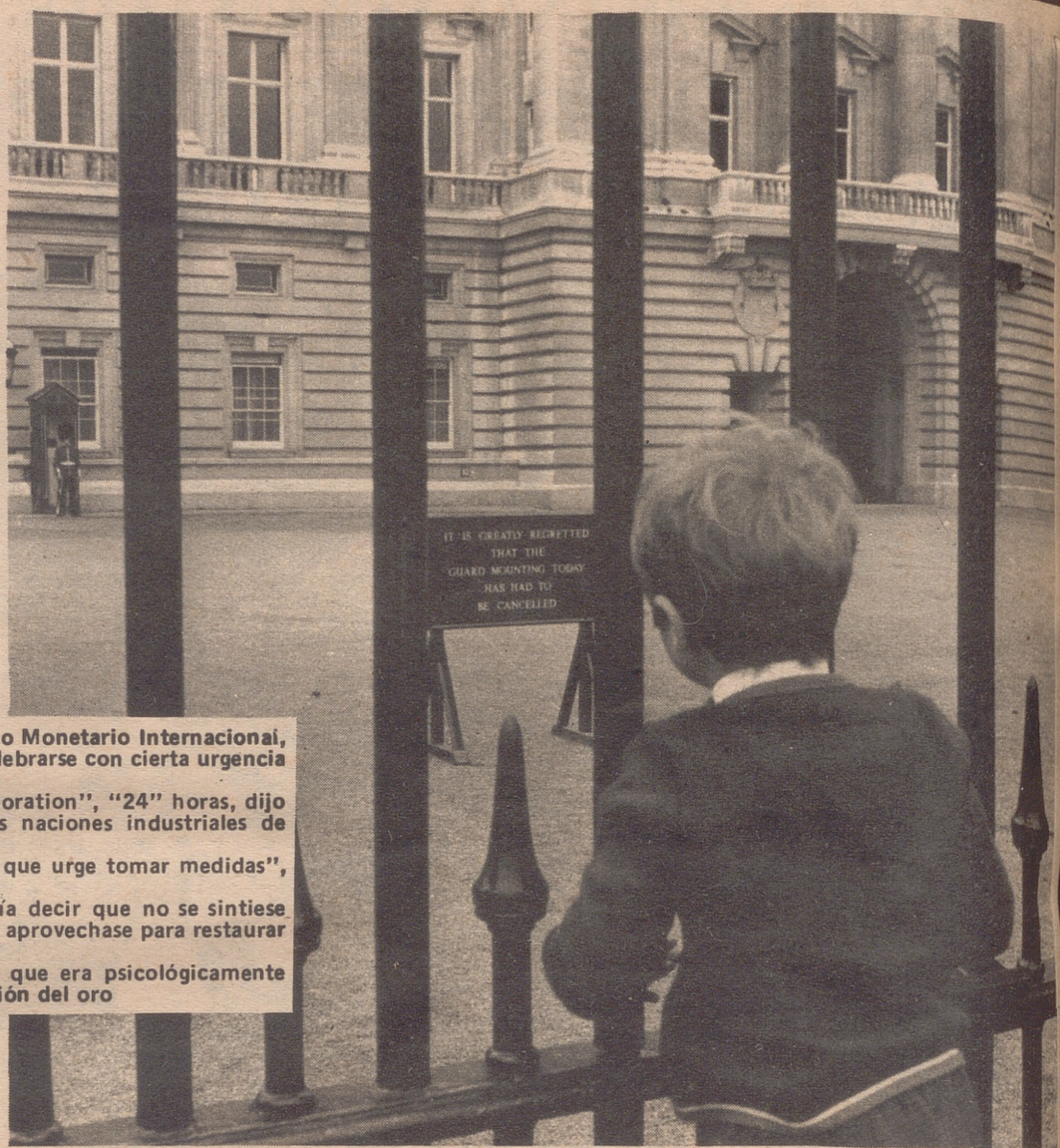
LONDRES.— El niño contempla desilusionado el aviso puesto ante el Palacio de Buckingham, residencia de la familia real, en el que se anuncia que ha sido suspendida la vistosa ceremonia del relevo de la guardia debido a la falta de soldados, dado que muchos de ellos han sido enviados a Irlanda del Norte.

Pide también que el Gobierno se apresure a persuadir a los Estados Unidos para que levanten su recargo del 10 por ciento sobre las importaciones en la fecha más próxima posible, y hace asimismo una llamamiento de urgencia a las finanzas para ayudar a las industrias japonesas pequeñas a que sobreleven el impacto causado por el recargo.