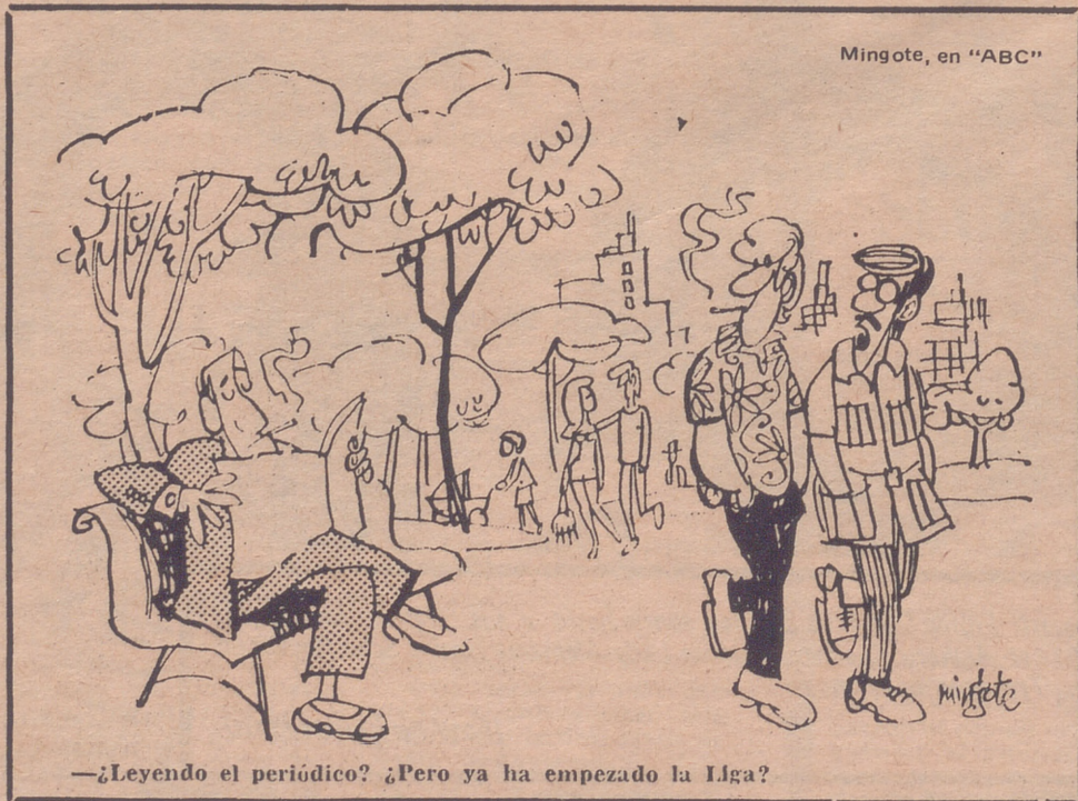
Mingote, en "ABC"