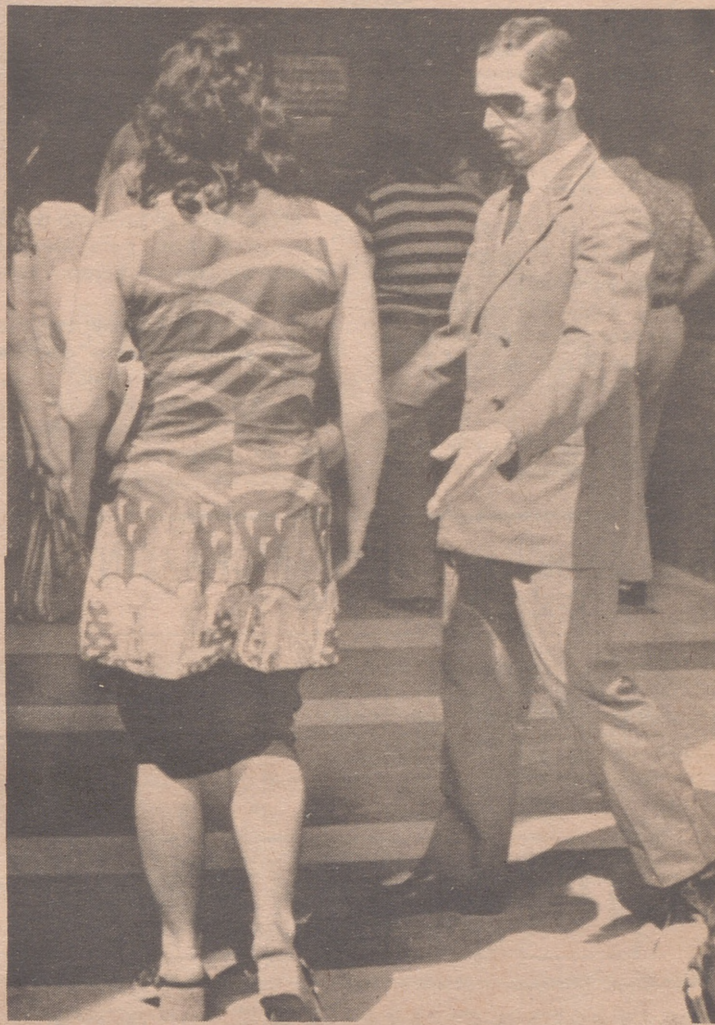
CIUDAD DEL VATICANO (Italia).— La guerra a la minifalda sigue su ritmo. En la puerta de la Basílica de San Pedro, un vigilante llama la atención a la señora que no se resigna a pasar sin la visita, para lo cuál ha decidido bajar la combinación y sustituir la falta de tela de su vestido. A pesar de todo, parece que este sistema tampoco es válido.