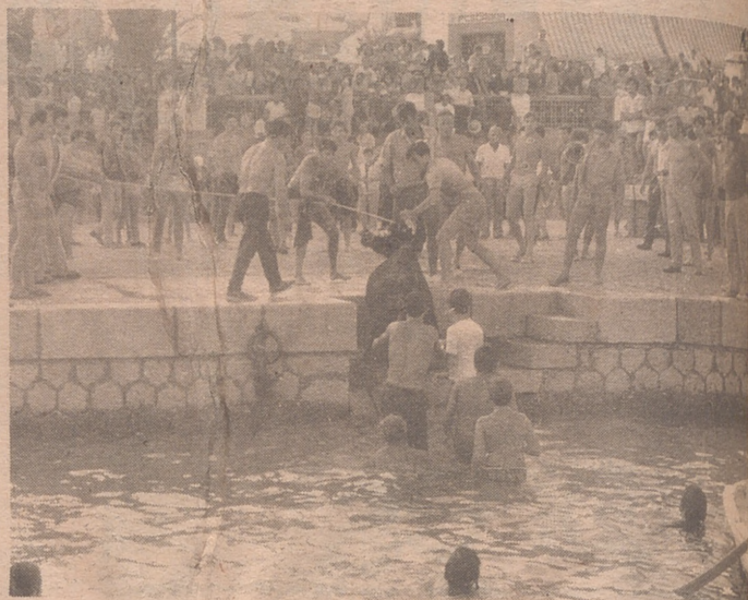
BENICARLO (Castellón).— Encierro típico en Benicarlo con revolcones y vaquillas junto al mar. La vaquilla, luego de corrida y cansada, se la remoja en el mar.