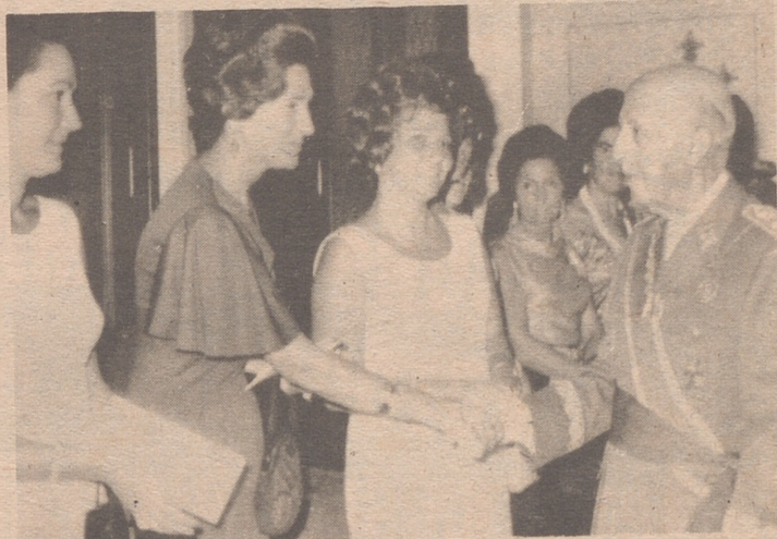
LA CORUÑA.- El Caudillo saluda a las damas que asistieron a la Cena de Gala celebrada esta noche en el Palacio Municipal en honor de S. E. el Jefe del Estado y esposa, a su llegada al Ayuntamiento.