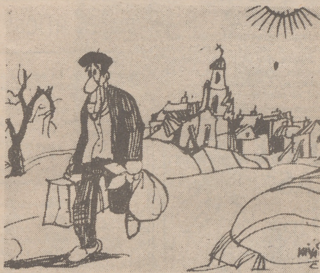
EL ULTIMO EMIGRANTE

—Bueno, en este pueblo, al menos, ya se ha resuelto el problema del campo.