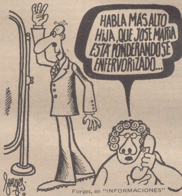
Forges, en "INFORMACIONES"