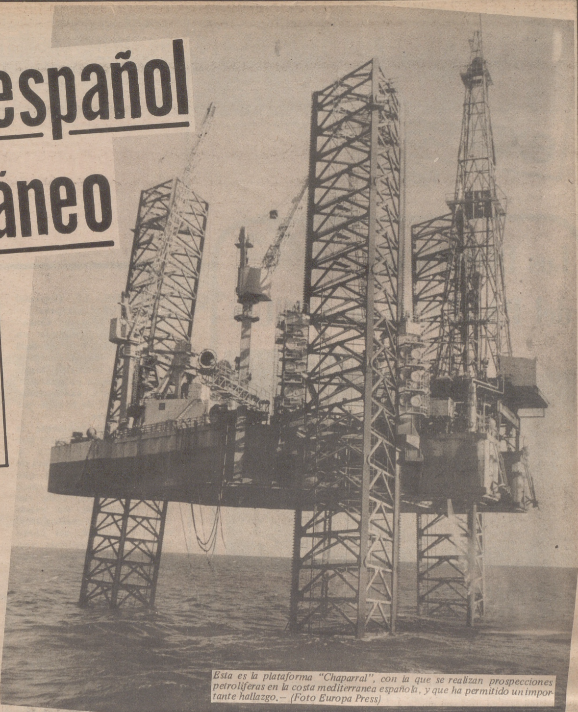
Esta es la plataforma "Chaparral", con la que se realizan prospecciones petrolíferas en la costa mediterránea española, y que ha permitido un importante hallazgo.

Algo tendrá nuestro subsuelo cuando tanto interés existe en explotarlo.