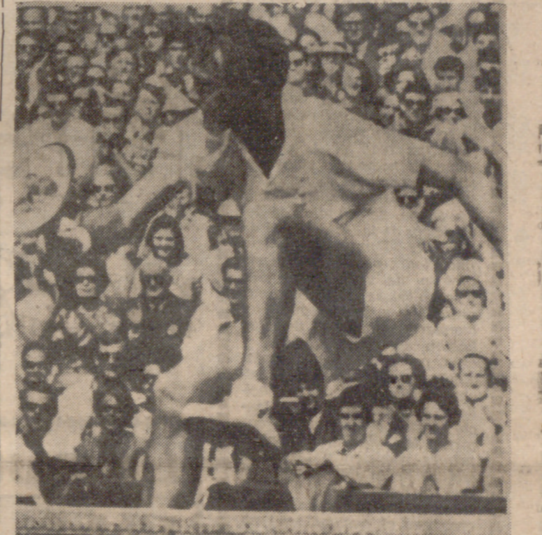
Newcombe, el reciente vencedor de Wimbledon, ha sucumbido ante Santana en Madrid. En el grabado, el momento júbilo de salir la red, tras haber vencido en el Campeonato Mundial aficionado de tenis sobre hierba.