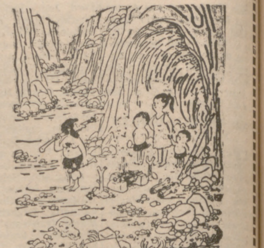
No dejes que los chicos jueguen con el juego. Podrían apagarlo.

HORIZONTALES.—1: Palo. Escasos. 2: Labrar. Tuéstalo. 3: Nombre de leira. Ciudad musulmana. Campión. 4: Terminación del aumentativo.