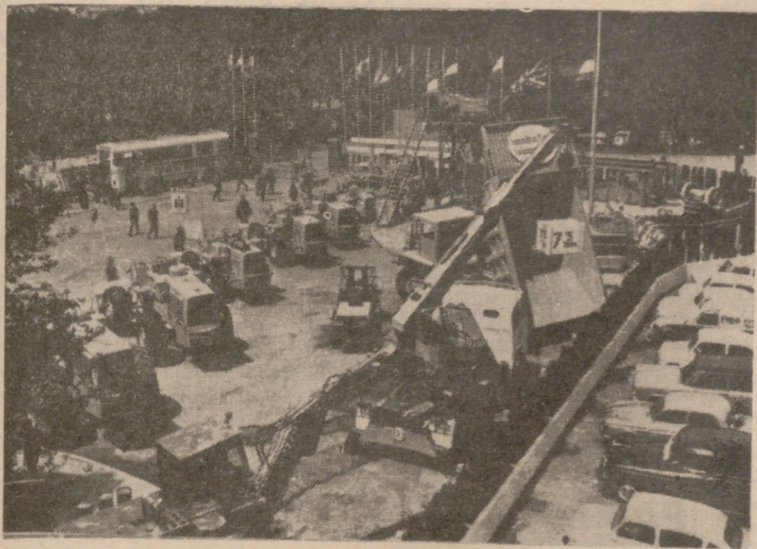
GIJON. (PYRESA). — Cuando el día 6 de agosto se inaugura la XI Feria de Muestras de Asturias, los gijoneses darán un respingo de satisfacción. Ha habido una inteligente preo-

Lo que se reanuda como verbena con salchichas y sidra es a los dos años un certamen internacional de primera magnitud