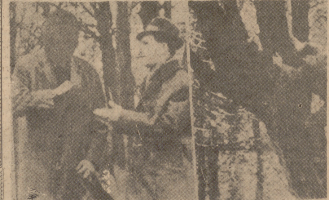
El oficio de espionaje de ayer: Un agente del Este recibe material secreto de su hombre de contacto alemán (a la izquierda). En el terreno de un parque de una gran ciudad de la República Federal de Alemania le fotografía un empleado del servicio de contraespionaje clandestinamente al vaciar un "buzón muerto" (a la derecha).

procesos químicos al tamaño de la cabeza de un alfiler, etcétera. El recurso a esos medios redujo considerablemente el número de agentes. La formación metódica hace de ellos especialistas que sólo rara vez caen en la red del contraespionaje. Reciben sus instrucciones en la banda de ondas cortas de un aparato de radio normal. Esos órdenes son tan bien cifradas, que ni computadores consiguen descifrarlas. Este cambio de método de los Servicios de Espionaje se hizo notar hasta en el Tribunal Federal en Karlsruhe: en el año 1965 fueron acusados ante este Tribunal por