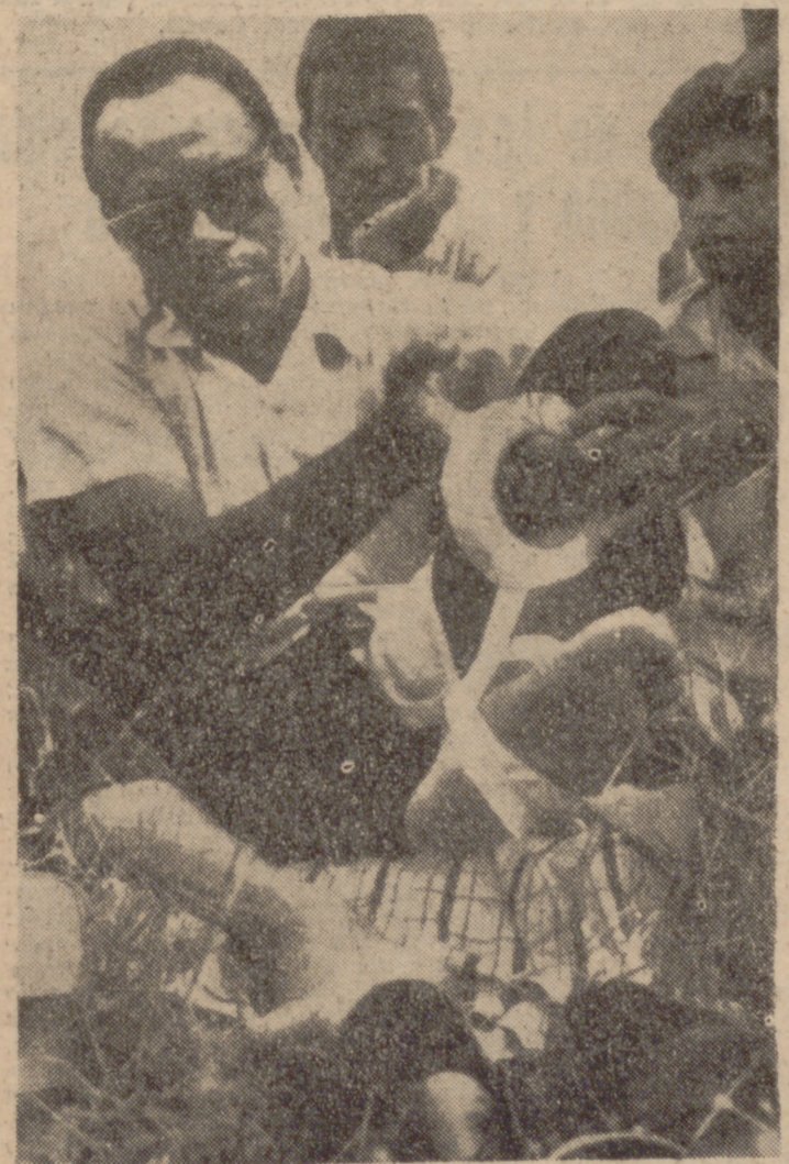
POPE (Mississippi).—James Meredith vanda su pie izquierdo durante su marcha a través de Mississippi. Otros componentes de la marcha aprovechan para descansar.