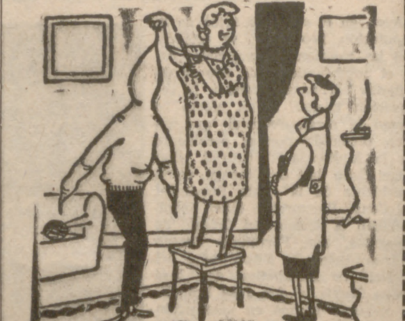
—¡Qué distraída soy! Siempre que hago algo de punto creo que es un calcetín.