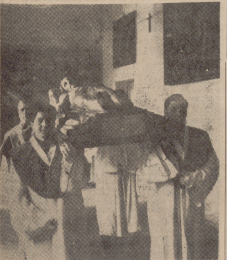
El Santísimo Cristo Yacente, al ser de nuevo internado en la clausura del convento de Santa Ana, después de las solemnidades de la Semana Santa y antes de comenzar la Procesión del Resucitado.