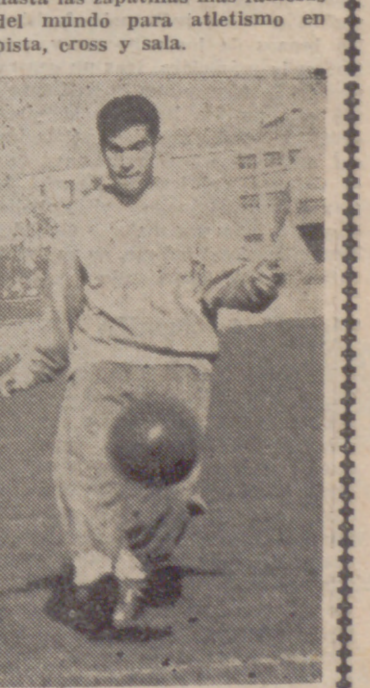
"La Casa del buen deportista", como final, ofrece la clasificación actual de su Trofeo:

Y "Deportes Blasco", al incluirle en su galería de destacados, se complace en presentar a la vez la más completa gama de material para la práctica de todas las especialidades deportivas. Desde el equipo más completo para deportes de invierno,