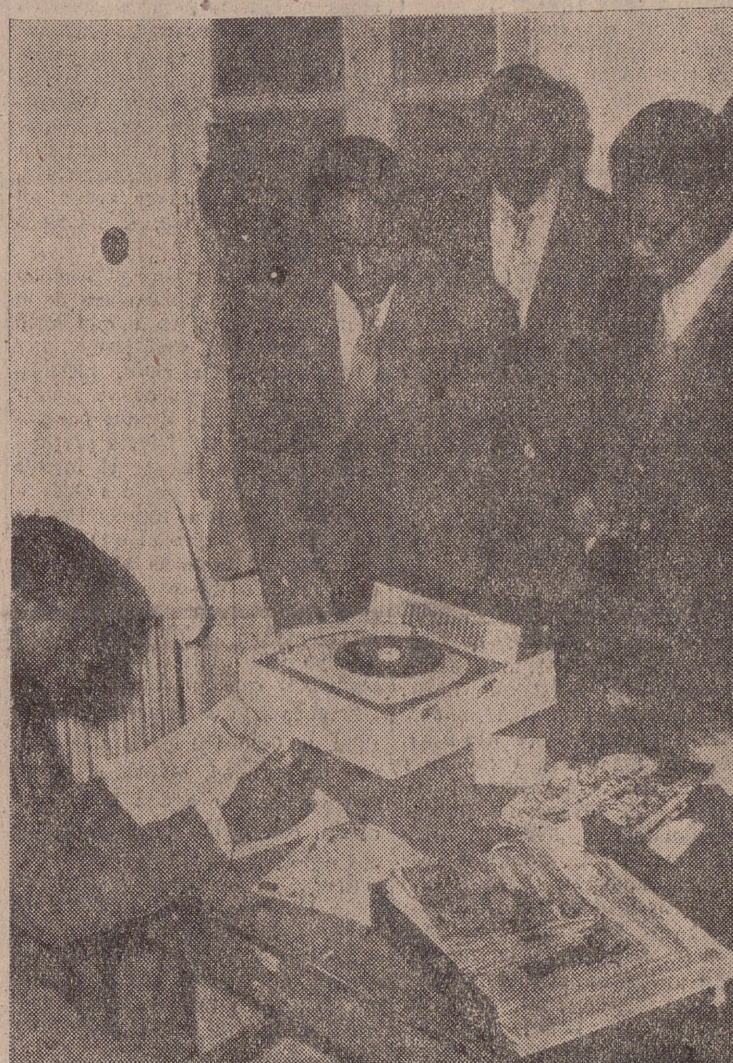
Un ambiente alegre y juvenil impera entre los estudiantes de la Residencia San Fernando.

En Santa Isabel funciona hace tiempo la Escuela Superior de Magisterio, en la que los nativos pueden titularse maestros auxiliares y seguir cursos para empleados administrativos del Gobierno. Además, en tiempos