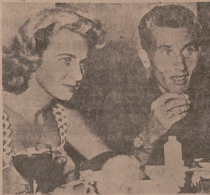
En la localidad de Rimini, Jacques Anquetil y su esposa, Janine Boeda, comen en un restaurante. Janine se casó con el campeón ciclista en segundas nupcias, después de una corta permanencia al lado de su primer marido, del cual se divorció luego de un gran escándalo en Francia. El caso de la esposa del corredor recuerda mucho al de Giulia Occhini con Coppi, pues también Janine se divorció de un médico para casarse con Anquetil.

SEMIFINALES DEL CAMPEONATO NACIONAL JUVENIL SABADO, DIA 11, A LAS SIETE DE LA TARDE Real Murcia-Real Valladolid Deportivo