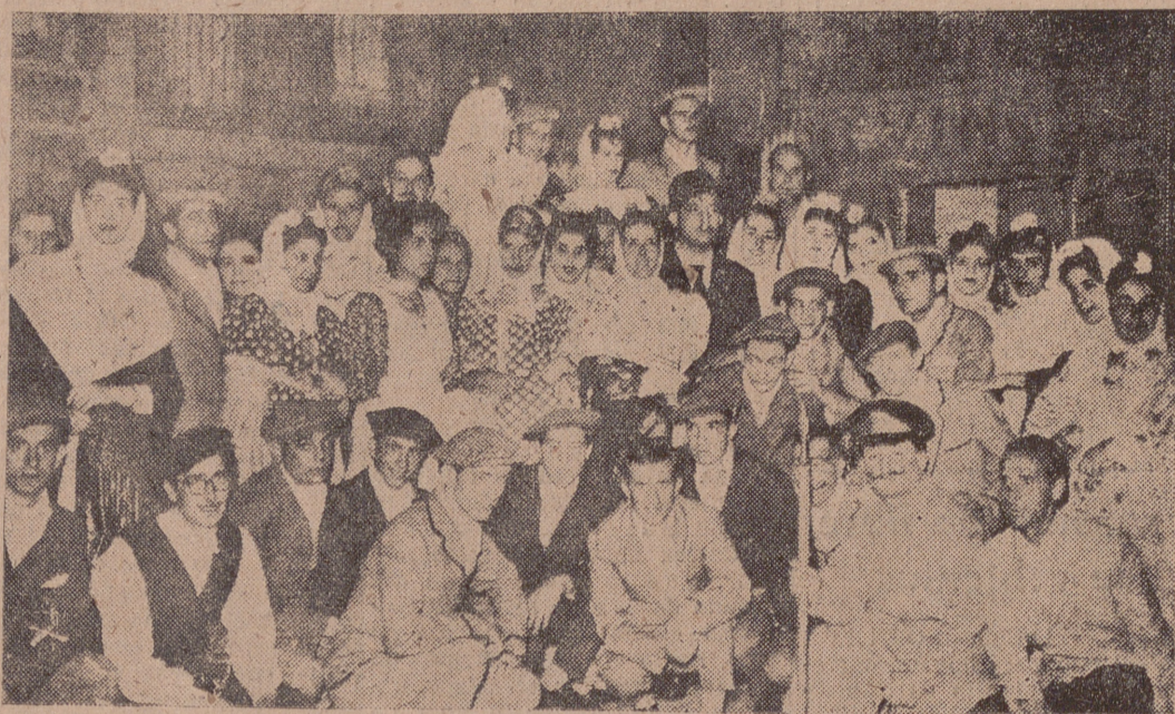
El cuadro artístico de «Amigos de la Zarzuela», que intervino en la representación de «La Ver- bena de Paloma».