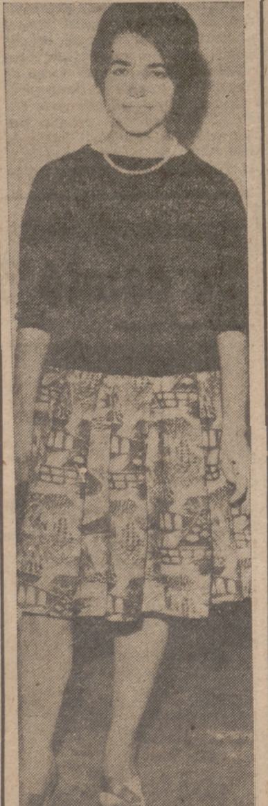
La Reina, en nuestra casa.