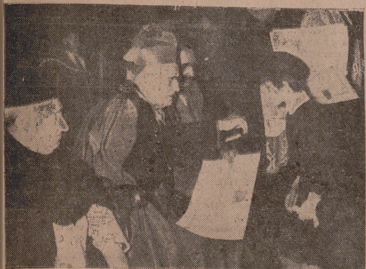
El Arzobispo entregando uno de los diplomas.

Coincidiendo con la fiesta de Jesús Maestro, se celebró ayer en nuestra ciudad el "Día del Catecismo", organizado por el Secretariado Catequístico Diocesano.