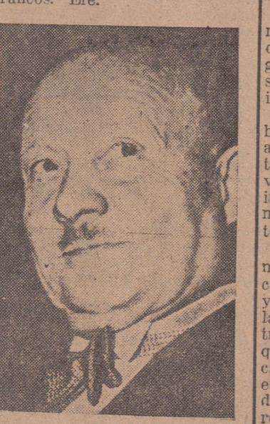
ANDRE LE TROQUER