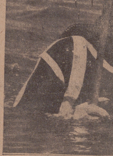
Preparando una inmersión con el avión submarino.

Se calcula que la séptima parte del oro, la plata y piedras preciosas extraídas por el hombre del subsuelo —unos setenta mil millones de pesetas— permanecen ahora bajo las aguas. Pero