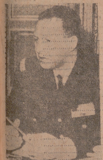
El GENERAL CHALLE

Argel. — Las autoridades han declarado el estado de sitio en Argel. — Efe. GIGANTESCA MANIFESTACION Argel (urgente). — Los colonos de "ultraderecha" se manifestaron tumultuosamente en las calles de Argel e iniciaron una huelga general en una "abierto prueba de fuerza" contra la autoridad del general De Gaulle. Una multitud, que se estima en