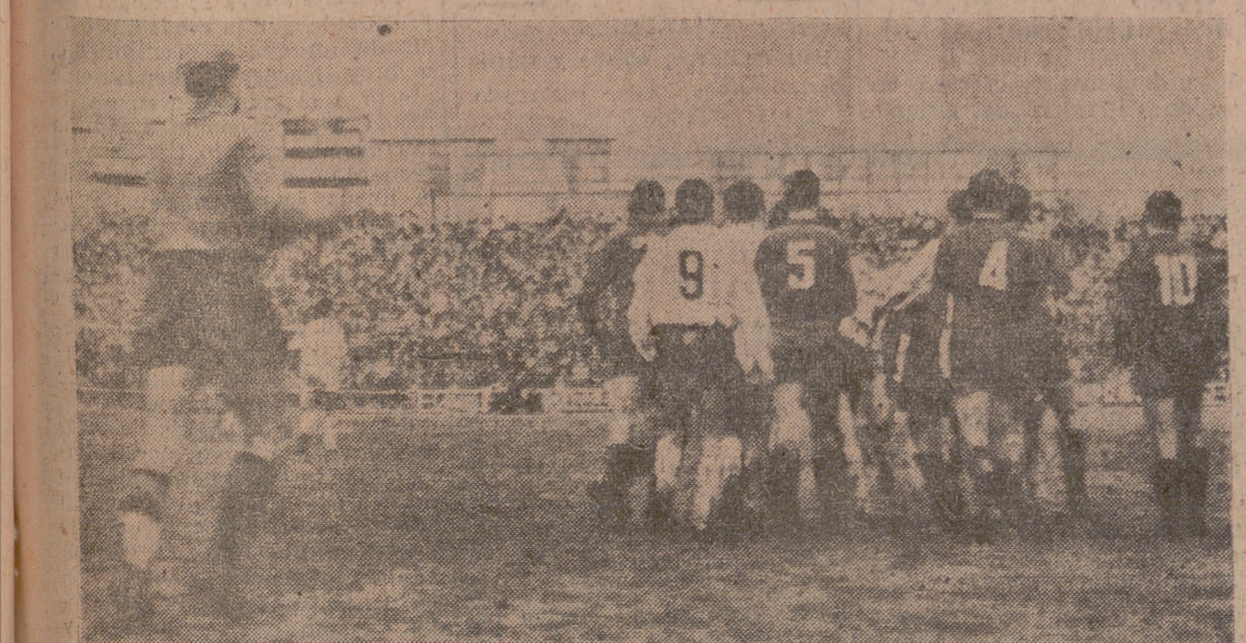
Ayer hubo escándalo en Zorrilla por culpa — ¿cómo no? — del árbitro. Después del tercer gol hubo un "no" muy regular entre los jugadores y el inepto Plaza. Los pamploncos pedían la anulación, y los blanquiverdes instaban al juez para que mantuviese su decisión, y así estuvieron más de cinco minutos, uno por cada gol de los que el equipo local marcó al Osasuna. Lea "Castilla Deportiva".