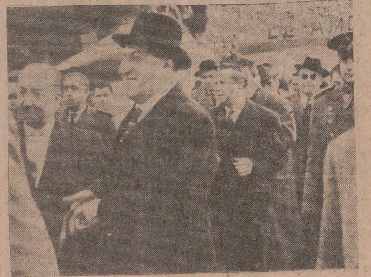
El embajador de España en Cuba, señor Lojendio, a su llegada al aeropuerto de Barajas, después de su expulsión de aquel país.