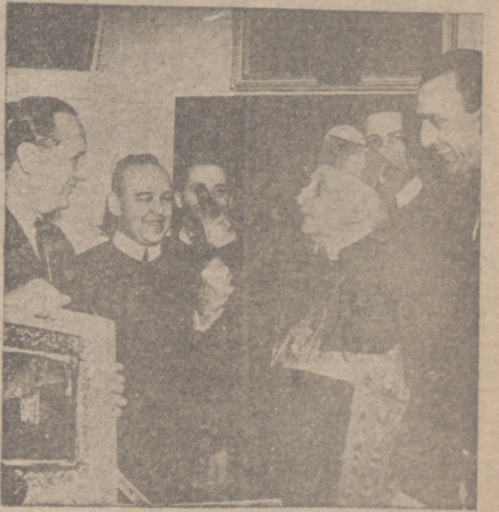
CIUDAD DEL VATICANO.—Su Santidad el Papa bendice desde la silla gestatoria a los miles y miles de fieles que se congregaron en la Plaza de San Pedro para presenciar la solemne ceremonia de cierre de la Puerta Santa, que marca el fin del Año Jubilar de 1950.—Abajo: El ministro de Justicia, señor Fernández Cuesta, en el acto de entrega al Cardenal Verde de la bandaja y paleta de plata, regaladas por S. E. el Jefe del Estado para las ceremonias de clausura de la Puerta Santa, en la basílica de Santa María la Mayor.

Washington, 27.—Oficialmente se ha hecho pública la designación de Stanton Griffis como embajador de Estados Unidos en España, el cual, según se cree, tomará posesión de su cargo una vez transcurridos los primeros días del año próximo.