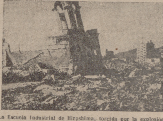
La Escuela Industrial de Hiroshima, torcida por la explosión de la primera bomba atómica.