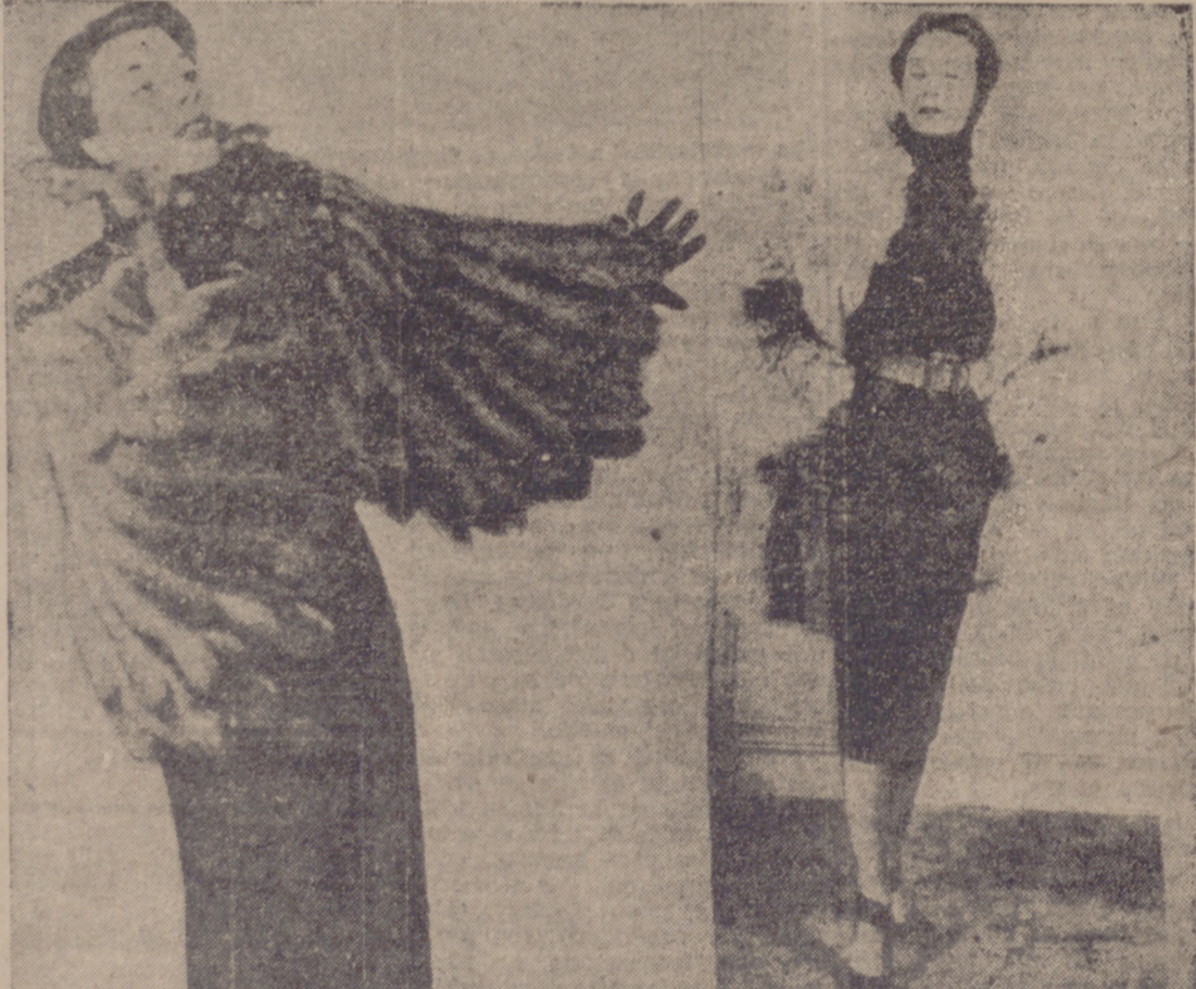
Dos nuevos modelos en el amplio campo de la moda femenina de invierno: Capa de visón, azul plateado, que forma mangas a manera de alas imitando doble hilera de plumas en el borde; el canesú está bordado de lantejuelas; cuello en ondas. El otro modelo corresponde a un vestido de invierno en gris oscuro. El chaquetón que lo completa es de piel de lobo.