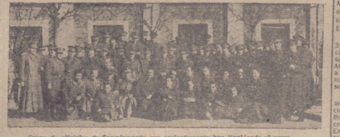
Grupo de oficiales de Complemento que recientemente han finalizado el curso.