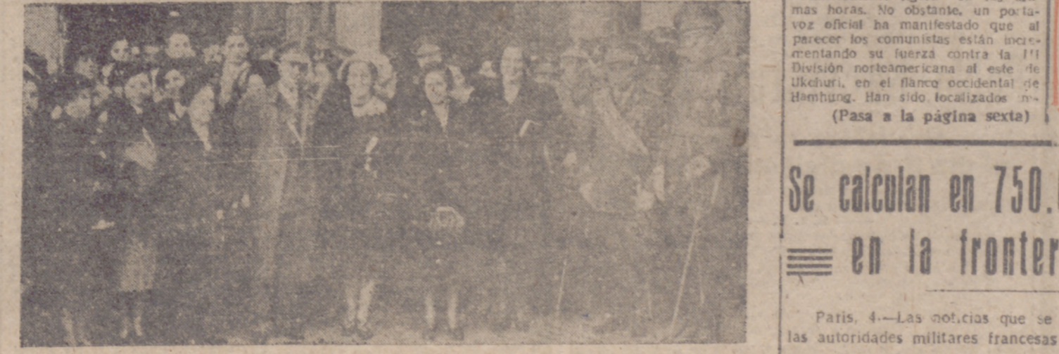
Damas de Santa Bárbara y autoridades a la salida de la misa en El Salvador (INFORMACION, EN LA PAG. 3A.)