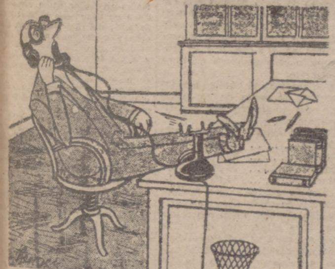
—No, neurocalcolumbencocoloidon... N como Narciso, E como Eugenio, U como...—

Esta es una historia del otro lado del telón de acero. Durante un año de campestres en la zona oriental de Alemania, el comisario responsable de las entregas de trigo a Rusia estaba colérico.