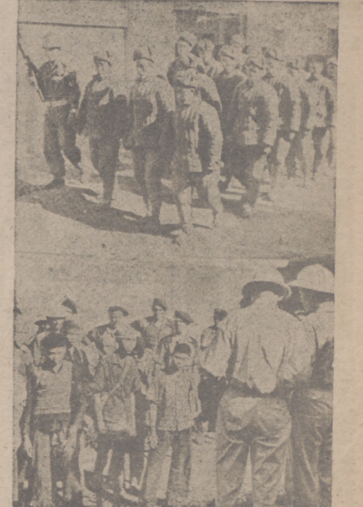
Continúa la grave situación en Corea, donde los aliados se retiran como pueden. He aquí un grupo de prisioneros comunistas chinos con uniforme de invierno.

También sobre Indochina se cierne la amenaza de una próxima ofensiva roja. En la "foto", parlamentarios franceses y vietnamitas negocian un intercambio de prisioneros.