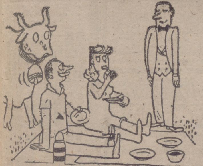
—La campanilla ha sonado, señor. (De "Le Rouge".)

Por Londres ha circulado estos días el siguiente diálogo, en el que el silencio de los nombres de los protagonistas (sobre todo el del protagonista), se comenta como un indicio de la evolución de Inglaterra: