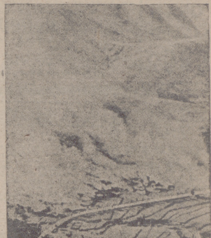
A consecuencia de los duros combates librados en el sector de Waegwan, la ciudad de Adok ha sido pasto de las llamas.

Los asistentes se trasladaron después a la Plaza del 13 de Septiembre, donde se colocó una corona en la placa que da el nombre a la plaza. Hizo la ofrenda el alcalde accidental en nombre de la ciudad, y se interpretaron los Himnos Nacional y del Movimiento. La Banda de música de la Agrupación de Infantería de Montaña núm. 8 dió un concierto en la Alameda de Calvo Sotelo, que se ha visto muy concurrida. En los edificios públicos ondearon las banderas nacional y del Movimiento en conmemoración de la fecha.—Cl. fra.