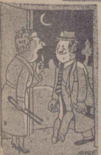
—No, sinvergüenza. Na contrío; que res mi boca doble.

Por Londres ha circulado estos días el siguiente diálogo, en el que el silencio de los nombres de los protagonistas (sobre todo el del protagonista), se comenta como un indicio de la evolución de Inglaterra: