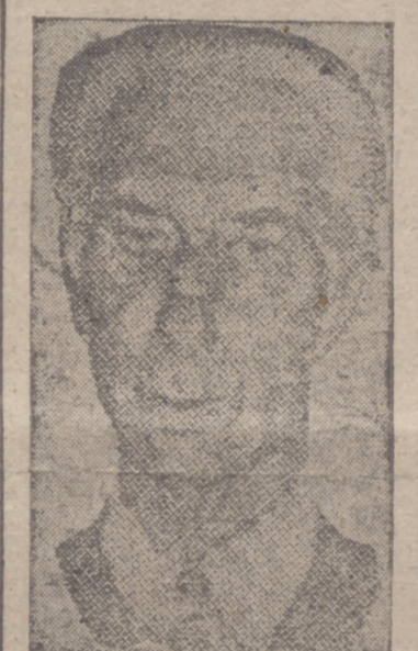
Adenauer EUROPA NO PUEDE SALVARSE SOLA. Sin, pero estas tropas se encuentran en números muy insuficientes. (Pasa a la página siguiente)