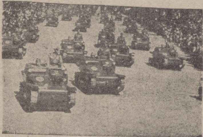
La Wehrmacht roja, disfrazada de "policia popular" y provista de excelente armamento, podría iniciar la agresión rusa sin aparente intervención del ejército rojo.

Cuento, nostalgia, estrella y palabras peligrosas en la zona oriental de ALEMANIA