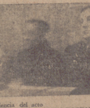
La presidencia del acto INFO RMACION EN PAGINA 3.ª

Con varios actos se honró la festividad del santo Patrón del Centro