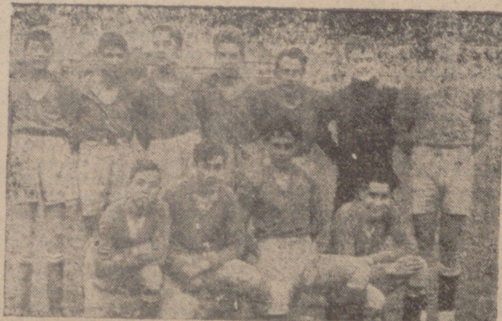
Con motivo de la festividad del Patrón de la Escuela de Formación Profesional «Onésimo Redondo», ayer se celebró un encuentro de fútbol entre un equipo compuesto por los alumnos de Tercer Año y una selección de la Escuela, venciendo los primeros por 4-2.