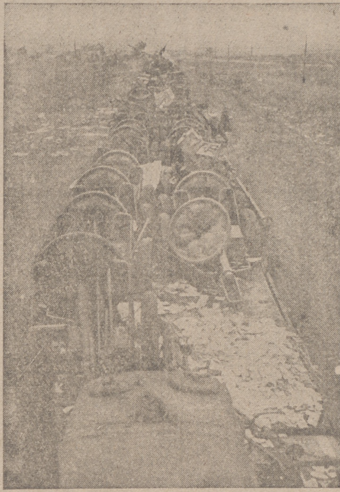
Este tren soviético, cargado de lanzagranadas y otras clases de material de guerra, no logró llegar a su destino, gracias a la precisión de los Stukas alemanes

SIGUEN LAS OPERACIONES EN HONG-KONG Londres, 20.—Según la agencia Reuter el gobernador de Hong Kong ha sido grafiado esta mañana que siguen desarrollándose las operaciones sobre la isla.—Efe.