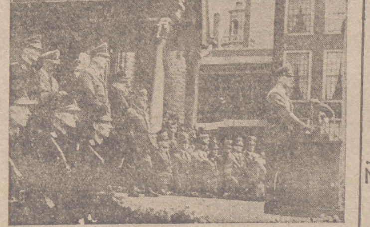
Todavía se siguen inscribiéndose diariamente gran cantidad de voluntarios holandeses para la cruzada anticomunista. He aquí al comisario del Reich, doctor Seyss Inquart, en una alocución a éstos antes de su partida

Los periódicos norteamericanos han hecho comentarios en torno a tal información, y alguno de ellos asegura que el espíritu de Wilson se ha filtrado a través de los muros en el interior de la Casa Blanca.—Efe.