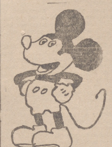
Victor Montero, 13 años. Amuequillo de Esgueva (Valladolid).