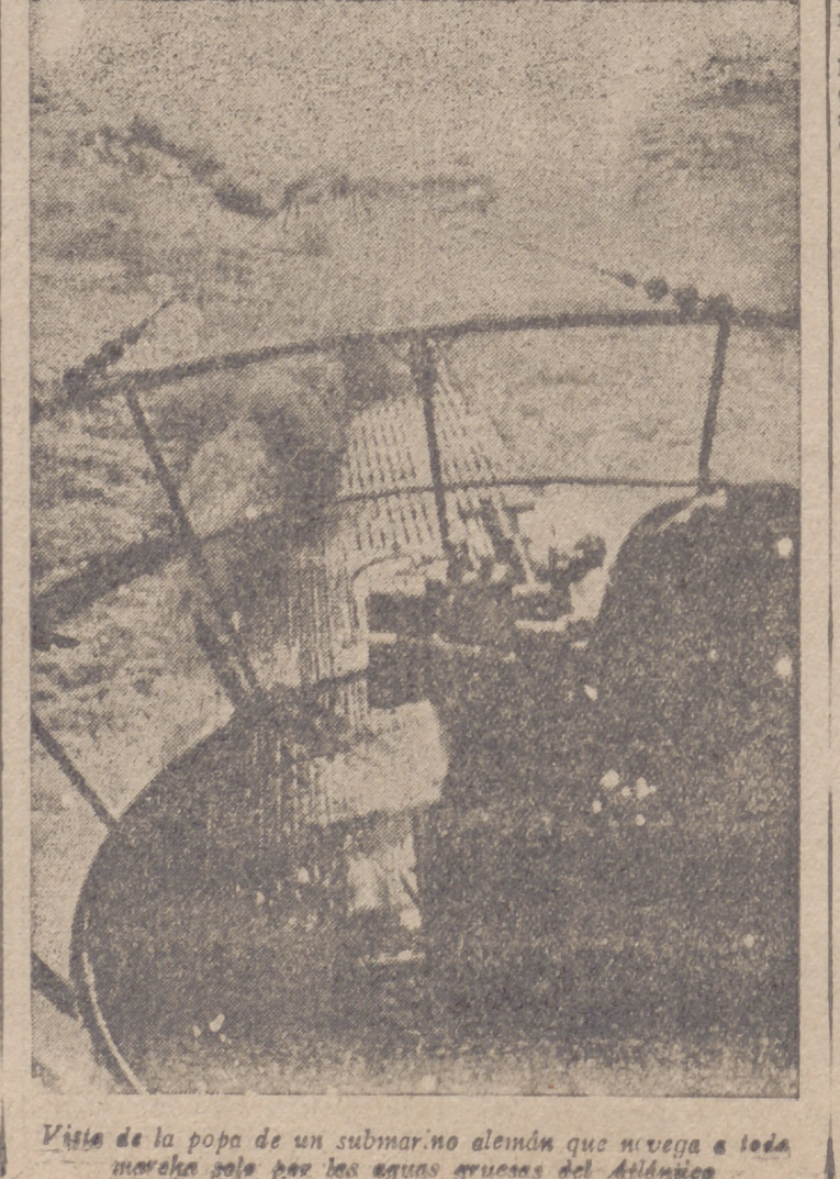
Vista de la popa de un submarino alemán que navega a toda marcha por las aguas gruesas del Atlántico