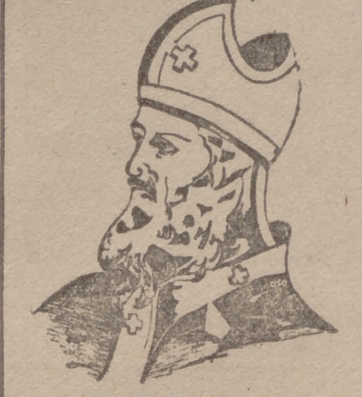
Froilán Alonso, 13 años.—Grupo de Cervantes.—Valladolid.