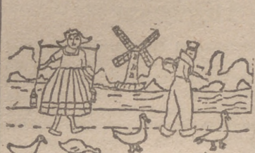
Ansel Vilha, 10 años.—Montemayor de Pihlla (Valladolid).