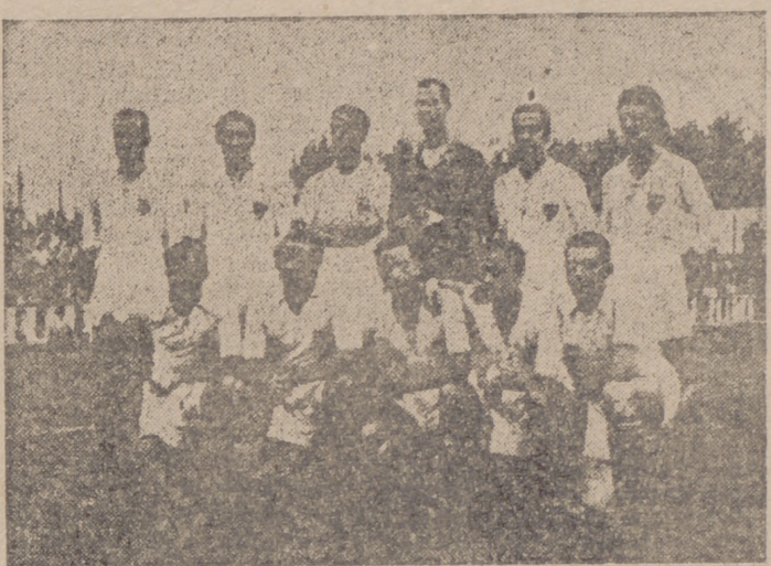
Los equipos del Atlético Aviación y del Valencia, primeros en la clasificación, que hoy juegan en Madrid y Sevilla, respectivamente, difíciles encuentros