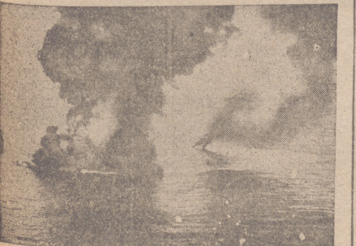
Un barco enemigo, diseñado por uno de los "Cóndor" alemanes cuando se pegaba en un convoy, fué atacado y bombardeado por él y al poco tiempo se hundió. Momento en que la primera bomba incendia por completo el barco