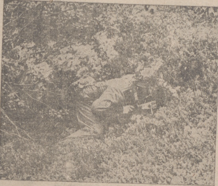
Zapadores alemanes atacan una posición fortificada rusa

"Las conferencias de los ministros europeos celebradas en Berlín esta semana han sido, a mi juicio, acontecimientos de capital importancia. No han sido actos políticos de valor externo ni de propaganda. Creo que los doce ministros que en nombre de sus respectivas naciones han firmado la prórroga del Pacto Antikomintern o se han adherido a él han realizado, con su presencia en la capital del Reich, algo más que una fórmula protocolaria. El espíritu y la actividad manifestados en las conversaciones personales que se han verificado entre los estadistas aquí reunidos han demostrado que estos hombres están plenamente convencidos de la necesidad de crear rápida y eficazmente un nuevo sistema que lleve a cabo la unión de Europa. Por todos estos motivos estoy satisfecho como europeo de la conferencia de Berlín. Pero también lo estoy como español, después de mis entrevistas con los ministros alemanes, y sobre después de la cordial conversación que sostuve ayer con el Führer, quien en esta ocasión me expuso con gran claridad y precisión la situación militar y política general."—Efe.