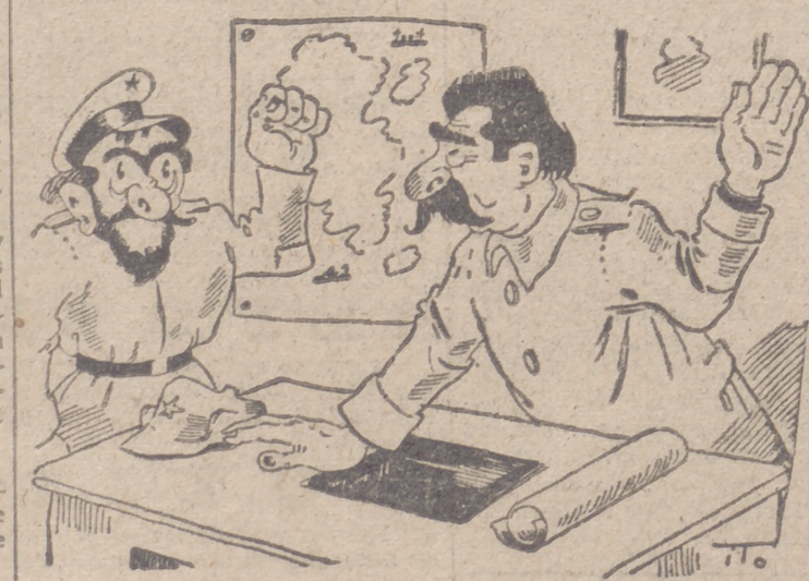
Momentos críticos Par ITO

A través de la Obra Sindical del Hogar, el Estado Nacional-sindicalista concede el 20 por 100 del coste de tu vivienda a fondo perdido, como premio a tu trabajo.