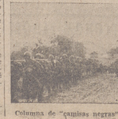
Columna de "camisas negras" en marcha en el frente ruso

Berlin, 29.—La agencia oficial alemana confirma autoriza