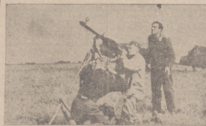
Ataque sorpresa soviético es rechazado inmediatamente con una ametralladora antiaérea en un campo de aviación alemán en el frente oriental

Asistieron al acto los rectores de todas las Universidades de España y altos cargos de Educación Nacional.