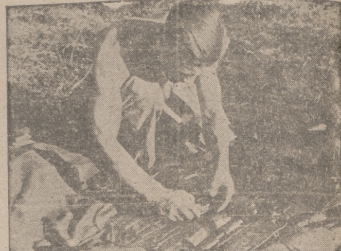
El cuidado minucioso de los instrumentos es indispensable para el éxito del trabajo, opina este soldado alemán de un Cuerpo de mecánicos del Ejército

Ciudad del Vaticano, 5.—Una misa en sufragio de los Cardenales muertos durante el presente año se ha celebrado solemnemente esta mañana, en la capilla Sixtina, con asistencia del Sumo Pontífice, todos los miembros del Sacro Colegio, el príncipe de Lichtenstein, el gran maestro de la Orden de Malta, el Cuerpo Diplomático acreditado en la Santa Sede, altos dignatarios de la Iglesia católica y personalidades de la sociedad romana. Durante la misa, oficiada por el Cardenal Fumasoni Biondi, los coros pontificios actuaron bajo la dirección del maestro Perossi. Como se sabe, los Cardenales muertos durante los meses transcurridos del año 1941 son el Cardenal S. hulte, Arzobispo de Colonia; Kaspar, Arzobispo de Praga; y Lauri, camarero de la Santa Sede.—Efe.