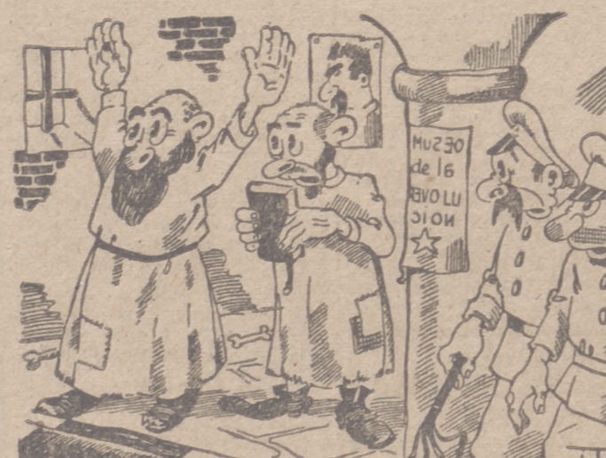
TCDO E "T ATRC" (Por ITO)

Vigo, 5.—De la nueva barriada que se construye en las Triaseras, en solares que dan frente a la zona en la que se hallan enclavados los edificios, campos de deportes y piscinas del Instituto de Enseñanza Media "Santa Irene", con cargo a los fondos del legado del filántropo don Policarpo Sanz, forman parte dos bloques de edificios dotados de planta baja y cinco pisos, en los que se trabaja activamente. Uno de estos bloques consta de 22 edificios, mientras que el otro es de 30, los que contribuirán a mitigar el serio problema de la vivienda en Vigo con sus 272 viviendas modernas, sin contar las plantas bajas, que suman otros 52 locales, reservados a instalaciones comerciales e industriales. La nueva barriada se levanta en un extremo de la Gran Vía del Generalísimo Franco, actualmente en construcción, frente a la plazoleta de arranque de la Gran Vía de la playa de Samil, zona balnearia de Vigo, avenida de 60 metros de anchura, cuyas obras, que forman parte del