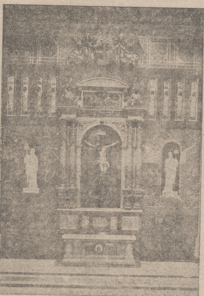
Altar de Cristo Rey de los Mártires de la Religión y de la Patria y Monumento de la Victoria, del Santuario Nacional de la Gran Promesa, donde hoy se celebrarán los actos religiosos con que nuestra ciudad celebra el "Día de los Caídos".

Han sido demasiado valiosas, generosas y abundantes las vidas entregadas por nuestra Revolución y por la total y definitiva soberanía española para que diariamente no esté en nuestra memoria el dolor, el recuerdo y la ejemplaridad. Pero en este día se centrará todo el dolor y recuerdo falangista y español para honrar y besar a los que perpetuamente nos señalan con su sangre y ejemplo la senda que la redención del pueblo español precisó un día, sin olvidar hoy la honra que en Rusia combaten por la garantía de la civilización europea y nuestra presencia en el concierto universal.