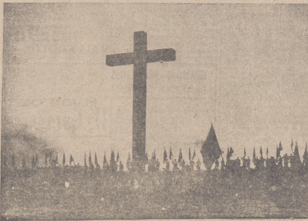
La Palanca ante la Cruz de los Caldos

observa lealmente todas las reglas que regían la comunidad internacional, y nunca regateó su colaboración y los esfuerzos para mejorarlas; y aun en las asambleas ginebrinas procuró—ingenuamente—con su voz y el aliento de su gloriosa tradición jurídica servir este objetivo. Pero el monstruo comunista abrió un profundo foso en Europa y separó en dos mundos distintos aquella comunidad de veinte siglos de civilización cristiana. Frente a la odiosa e intolerable amenaza antihumana del puño cerrado surgió otra concepción más generosa de la vida. El amor, la construcción, el orden, la fe y la armonía se opusieron al odio, la destrucción, la indisciplinada, la desesperación y el caos.