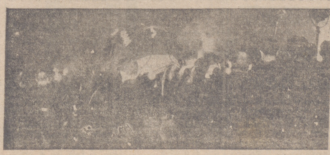
Los restos de José Antonio atraviesan las tierras de España sobre los hombros de sus escuadristas

Sevilla, 28.—El vicesecretario general del Partido, camarada Luna, se reunió en la Jefatura Provincial con las jerarquías provinciales y locales y otras representaciones de la Falange sevillana. El camarada Luna habló a los reunidos y les dió unas consignas. Dijo que la Falange de Sevilla es una de las mejores de España. Terminó el acto cantándose el "Cara al Sol".—Cifra.