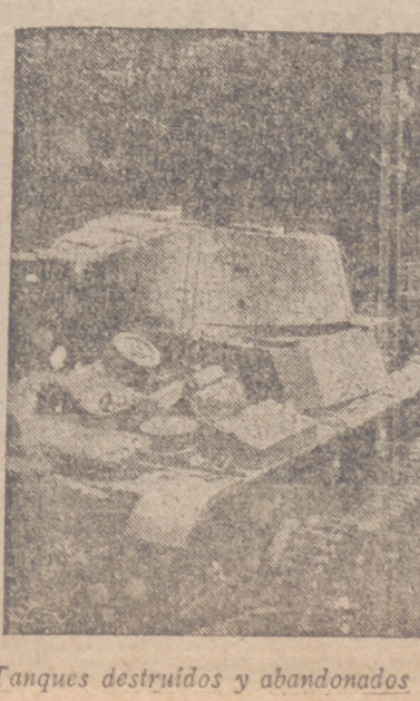
Tanques destruidos y abandonados por los rusos en sus retiradas