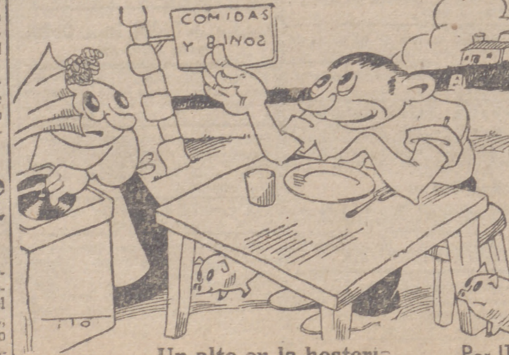
Un alto en la hostería. Por ITO. —¿Qué prefiere usted? —Un "toston", pero con mucha salsa.