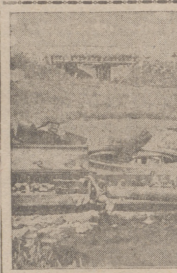
Tanque soviético de 90 toneladas inutilizado en un arroyo

Prensa. Asistieron las autoridades, jerarquías de F. E. T. y de las J. O. N. S. y los periodistas de la capital. Después del acto religioso los asistentes se trasladaron al monumento a los caídos, donde depositaron una corona.—Cifra.