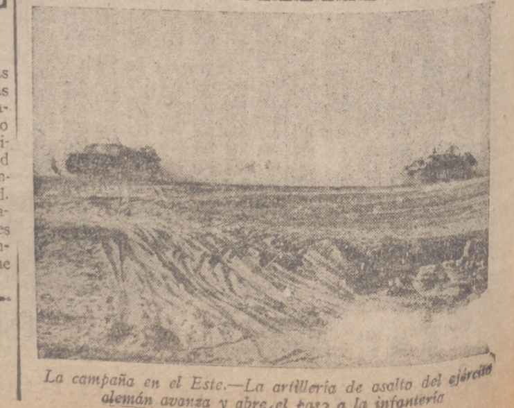
La campaña en el Este.—La artillería de asalto del ejército alemán avanza y abre el paso a la infantería

San Sebastián, 22.—Esta noche llegaron a esta ciudad las enfermeras del equipo sanitario de la División Azul que marchan a los frentes de Rusia. En la estación, fueron recibidas por las autoridades provinciales y representaciones del Cuerpo de médicos de Guipúzcoa, así como de numerosos médicos. Hicieron noche en San Sebastián y mañana emprenderán el viaje con dirección a la frontera. Los sanitarios que acompañan al grupo expedicionario que danon en Irún y se reunirán mañana con las enfermeras para proseguir juntos el viaje.—Cifra.