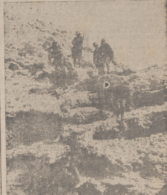
Formación de reconocimiento alemana en el Africa del Norte en terreno montañoso

Sofía, 1.—El Estado Mayor del Ejército búlgaro comunica que las aguas territoriales búlgaras serán minadas, a partir del 2 de julio, entre los siguientes límites: al Este de la costa búlgara, desde los 28 grados un minuto de longitud Este hasta la costa y desde los 42 grados 18 minutos de latitud Norte hasta los 43 grados 15 minutos. Los puntos de entrada y salida de la zona minada serán al Sur del pueblo de Pomorsky y al Norte de Cavnra. Las Compañías navales deberán avisar al Estado Mayor búlgaro con doce horas de antelación de la llegada de barco a puerto.—Efe.