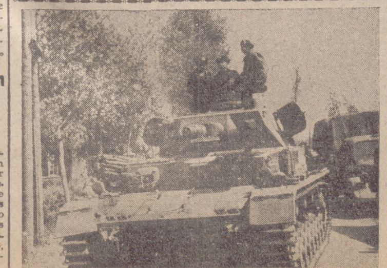
La lucha contra el bolchevismo.—Grandes columnas blindadas alemanas se han concentrado en la frontera rusa para hacer desaparecer la amenaza roja. He aquí el paso de un tanque pesado alemán por una carretera del Este

Estocolmo, 1.—Las fuerzas soviéticas han fusilado en Reval un gran número de patriotas estonios por haber encontrado depósitos clandestinos de armas y municiones, que se supone que estaban dispuestas para ser empleadas en el momento en que la proximidad de las tropas alemanas permitiera luchar a los estonios contra los bolcheviques, según informa el «Svenska Morgensblatta». El periódico añade que los rusos han formado un batallón de mujeres estonias, que ya han sido llevadas al frente de batalla.—Efe.