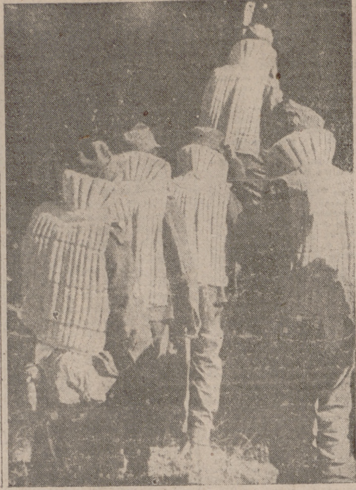
Cazadores alpinos alemanes

Berlin, 1.—(Ampliación al comunicado del Alto Mando Alemán).—También se han distinguido en los combates del Este el teniente Haaf, de un regimiento de Ferrocarriles, que impidió la voladura de un puente ferroviario de gran importancia, y el cabo Reiser, perteneciente a un regimiento de Artillería, que en un breve espacio de tiempo destruyó con su pieza catapulta torpederos soviéticos. Un grupo de aviones de bombardeo mandado por el comandante Busch, en los ataques aéreos efectuados contra Inglaterra hasta el 15 de junio, ha hundido un crucero, un destructor y 21 unidades navales más pequeñas, así como 436.188 toneladas de barcos mercantes enemigos. Además ha averiado a numerosos vapores más.—Efe.