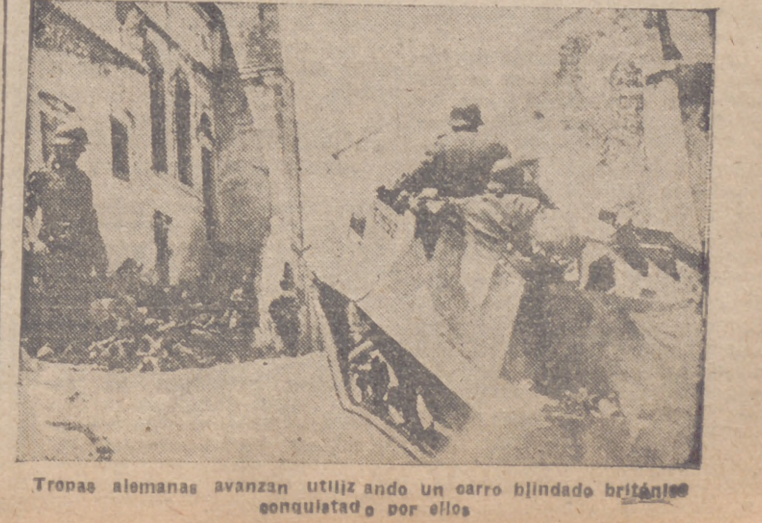
Tropas alemanas avanzan utilizando un carro blindado británico conquistado por ellos

en las nubes, pero fueron perseguidos por los pilotos del Reich, que lograron derribar a seis "ratas" más.—Efe. OLEADAS DE AVIONES Berlín, 24.—Desde el comienzo de las hostilidades en el frente del Este la aviación alemana bombardea constantemente, en sucesivas oleadas, los objetivos de importancia militar de la Unión Soviética. Las fábricas de armamentos, las concentraciones de tropas y las bases aéreas, así como los depósitos de carburantes y arsenales de municiones, han sido destruidos en gran parte. Un bombardero alemán que volaba aislado atacó el 23 de junio un tren petrolero. Veintiseis vagones volaron por efecto de la explosión entre grandes llamas.—Efe.