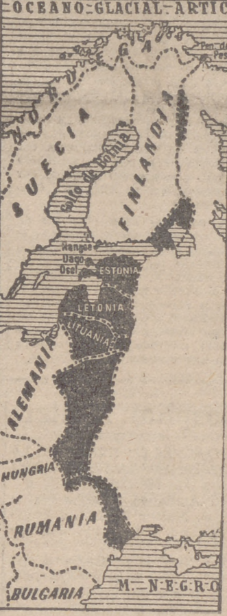
La expansión de Rusia sobre Europa.—Península de Pescadores, Salla, Carelia, Haugo, Estonia, Letonia, Lituania, Polonia, Bucovina y Besarabia.

Después todo se reduca a saber aprovechar las circunstancias: o Alemania transigia o perdía los torpes suministros que lentamente iban proporcionando a buen precio. Desde septiembre de 1939 hasta anteayer Rusia había avanzado sus fronteras en busca de la línea zarista, y aun superándola, como en el caso de la Bucovina, desde el Arctico al mar Negro. 500.000 kilómetros cuadrados y cerca de 22 millones de habitantes se sovietyaban repentinamente y contra su voluntad. Alemania habrá tenido, según el manifiesto del Führer, sus motivos para lanzar su máquina guerrera hacia el corazón de Rusia; pero toda Europa, y especialmente España, conocen pruebas suficientes. Rusia quería aplastarnos a todos. La guerra a Rusia es el mejor servicio.