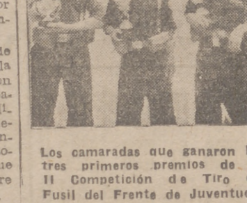
Los camaradas que ganaron los tres primeros premios de la II Competición de Tiro de Fusil del Frente de Juventudes