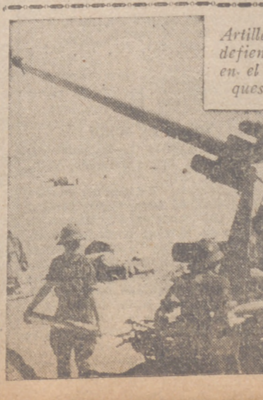
Artillería pesada antiaérea que defiende las posiciones alemanas en el desierto de posibles ataques de la aviación enemiga

Bilbao, 18.—En la Diputación se ha recibido un libramiento de 500.000 pesetas del Ministerio del Aire, primera entrega de la subvención de dos millones de pesetas con que el Estado contribuye a la construcción del aeropuerto, que llevará el nombre de Carlos Haya.—Cifra.