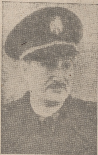
"Camaradas: Al inaugurar las tareas del II Consejo Sindical quiero no sólo dedicar un saludo a los delegados reunidos, sino también marcar, como jalones de un camino a seguir, algo de lo que en períodos anteriores se hubiera llamado pomposamente el programa o el guión del Consejo.

El ministro secretario general, camarada Arrese, en su discurso inaugural, ha dado la pauta a los discursos sindicales reunidos en el antiguo Palacio del Senado, porque desviándose de caminos de exceso andados y rompiendo con el tópico corriente en esta clase de intervenciones, se ha encarado con cuestiones precisas, sin dejarse llevar de cómodas y brillantes pero ineficaces divagaciones. Y, así, ha expuesto claramente un índice de realidades amargas que hay que poner fin, como la de "liberar al campesino de las redes usurarias". Una de las causas—aunque no la fundamental—de la ruina de nuestra Agricultura es la explotación e inhumana de los campesinos, que cargan sobre las explotaciones campesinas un intolerable peso de unos intereses exorbitantes. Pero sólo existe un medio de liberar a los campesinos de la usura: el crédito agrícola que proporcione con facilidad y poco coste a todo labrador, ya sea colono, ya propietario, los capitales necesarios para desenvolver su actividad productora. Este crédito, para ser válido, ha de estar adorado de características por completo distintas a las de los préstamos que se han realizado hasta el momento. Se impone, pues, una medida de tipo revolucionario, como la propuesta por el camarada Arrese, que se concreta en la movilización de la propiedad de la tierra, dando validez jurídica al título de propiedad, de arrendamiento, declaración de descuento obligatorio sobre cualquier Banco.