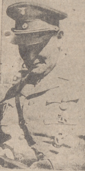
Berlin, 2.—El mariscal del Reich y comandante supremo de la Luftwaffe, Hermann Goering, ha publicado la siguiente orden del día: "Combatientes de Creta: Camaradas: Acaba de ser realizada una acción gloriosa y victoriosa de nuestra joven Arma. Nuestras banderas victoriosas ondean sobre Creta. Vosotros, mis paracaidistas y tropas de desembarco, y vosotros, mis aviadores, habéis realizado hazañas extraordinarias en unión con nuestros camaradas del ejército y a las órdenes de vuestros jefes, probados en el combate en todos sus grados. Lleno de alegría y orgullo quedo señalando al Führer que sus órdenes han sido cumplidas. Ante el mundo entero habéis demostrado la veracidad de las palabras del Führer: "Ya no hay islas inexpugnables". Yo sabía ya que mi aviación, probada en los combates más duros y llena de heroísmo, no conoce más que la victoria. Esta primera y audaz operación a través del mar ha aplastado al enemigo en pocos días. Una vez más las formaciones de la aviación italiana y las tropas de Italia han contribuido eficazmente al éxito de estas acciones. Paracaidistas: Llenos de valor, sin ayuda alguna, habéis vencido al enemigo numéricamente superior y dotado de mejor material, después de combates heroicos y encarnizados. En todos los lugares donde habéis aterrizado habéis atacado y defendido vuestras posiciones con el mismo heroísmo. Cada uno de vosotros ha dado pruebas de un valor más que extraordinario y de una tenacidad que sobrepasa el límite de las fuerzas humanas, a pesar del sol ardiente y de las altas temperaturas inaccesibles. Habéis sacado vuestras fuerzas de vuestro inquebrantable espíritu Nacional-socialista, del pensamiento en la seguridad de la victoria y de la ayuda de vuestros camaradas del aire, que han expulsado del cielo a los enemigos y que sin interrupción han llevado hora tras hora los refuerzos necesarios en los aviones de transporte.

Palabras de GOERING en su mensaje al Arma aérea