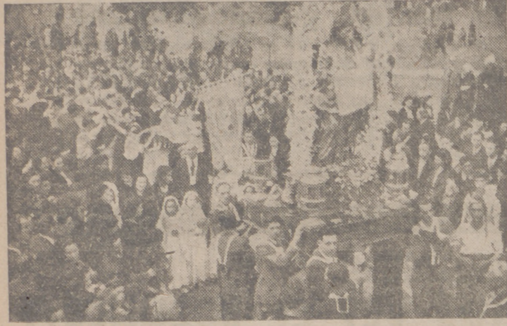
He aquí un aspecto de la procesión del Carmen, que este año revistió gran esplendor y animación. La ermita fué visitadísima durante todo el día, y sus alrededores estuvieron concurrencísimos.