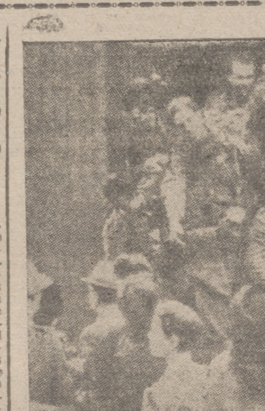
Soldados alpinos de Italia, de regreso del frente griego

se siente en una choza donde se mueren hasta los huesos las inclemencias del tiempo, donde la santidad de la familia es piroteada, donde no hay alegría, ni luz, ni calor. Vosotros sabéis que el hogar de muchos ha sido hasta ahora la tumba, la cárcel o el hospital, y que por ello estuvimos a punto de tener una Patria mandada por borrachos, por delincuentes y por enfermos. Hay que pensar en pueblos nuevos, con su iglesia y con su escuela como nudo fundamental; nuestro imperpetuo falangista tiene encauzado el problema con el Instituto Nacional de la Vivienda, magistral en forma y en organización, pero es preciso que sintamos la preocupación para