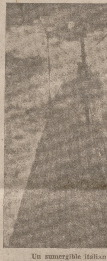
Un submarino italiano en el Mediterráneo