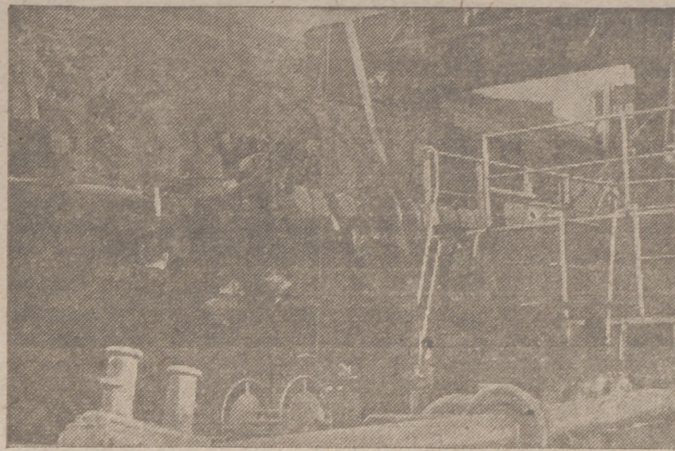
El abastecimiento de aceite y gasolina a la Marina de guerra del Reich