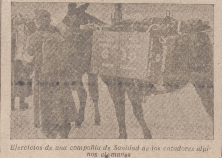
Ejercicios de una compañía de Sanidad de los cazadores alpinos alemanes

LOS MONARCAS INGLESSES VISITAN PLYMOUTH Plymouth, 20.—El Rey y la Reina han visitado hoy Plymouth. El Rey inspeccionó un contratorpedero de los recientemente transferidos a la Gran Bretaña por los Estados Unidos.—Efe.