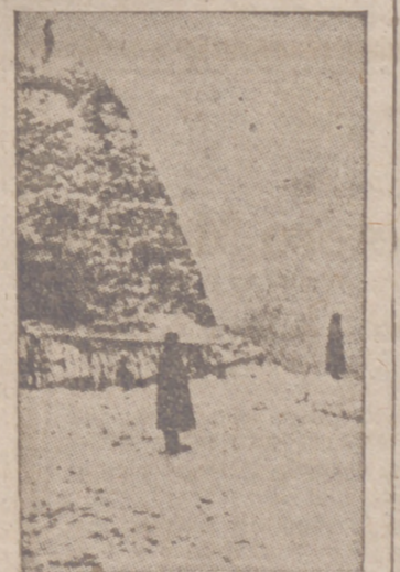
Soldados alemanes vigilan en la costa de la Mancha, cubierta de nieve

Berlín, 25.—Se tienen noticias de que un convoy británico que navegaba frente a la costa del África del Norte fué atacado por las fuerzas aéreas alemanas, que echaron