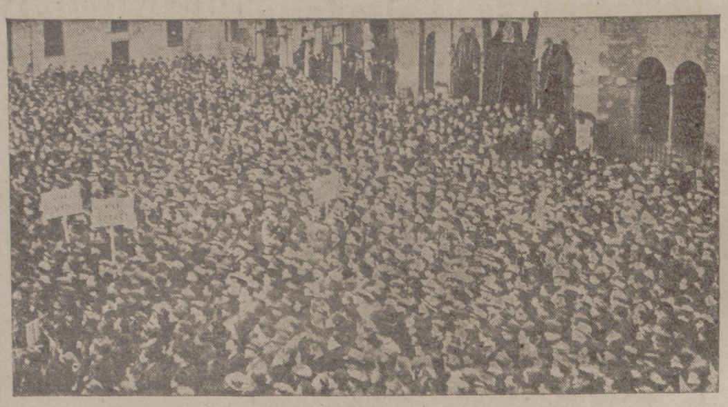
La población de Milán protestó, en una imponente manifestación, contra las mentiras difundidas por la propaganda inglesa diciendo que se habían producido disturbios antifascistas en dicha población y otras ciudades italianas

PARTE ALEMANA. Berlín, 25.— Comunicado del Alto Mando de las fuerzas armadas alemanas: «Los submarinos alemanes atacaron un convoy fuertemente protegido y hundieron, después de numerosos y encarnizados combates, 125.000 toneladas...»