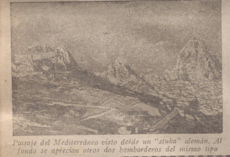
Paisaje del Mediterráneo visto desde un "stuka" alemán. Al fondo se aprecian otros dos bombarderos del mismo tipo

Además de estos el comunicado de hoy señala un brillante éxito de los «Stukas» al averiar gravemente en el Mediterráneo, al Norte de Derna, a un enorme transporte enemigo de 15.000 toneladas. Un barco, alcanzado de Heno por las bombas y envuelto en espesas nubes de humo negro, al mismo tiempo que empezaba a arder.—Efe.