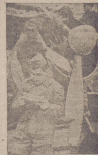
Aviadores italianos examinan cuidadosamente su aparato antes de emprender el vuelo

El Teatro estaba profusamente adornado con mantones de Manila y presentaba un brillantísimo aspecto. Todos los servicios del Teatro, desde los avisadores de coches hasta los acomodadores, pasando por el bar, venta de flores, caramelos, licores, etc., estuvieron a cargo de las figuras más destacadas de nuestra escena, que obtuvieron de esta manera considerables ingresos. Al final se subastaron cuatro valiosos regalos, entre los que figuraba una magnífica escultura, regalo de don Mariano Benlliure, y se rifaron unos cincuenta objetos, igualmente valiosos, donados por el comercio de Madrid.—Cifra.