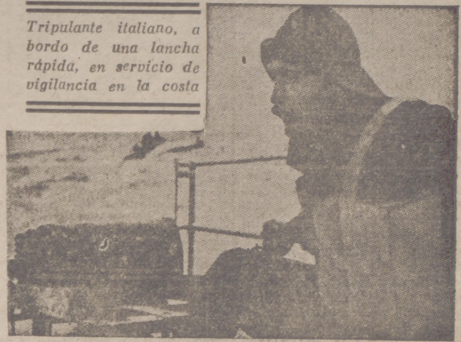
Tripulante italiano, a bordo de una lancha rápida, en servicio de vigilancia en la costa