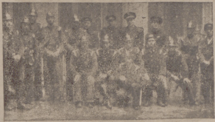
Grupo de bomberos que contribuyeron eficazmente a la extinción del incendio de Santander.

La ciudad en llamas La impresión a su llegada—una de la madrugada del domingo—fue im-