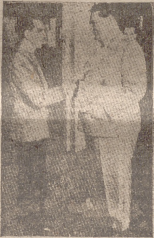
Goebbels felicita al mariscal Goering el día de su cumpleaños