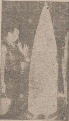
Enormes proyectiles en un depósito de municiones del Reich

han sido ya estudiados con el Gobierno argentino, cuando los ministros de Negocios Extranjeros pasaron por Buenos Aires. El Gobierno argentino prometió recomendar tales solicitudes a la Conferencia. En la actualidad lo que se resuelve depende en gran parte de la actitud del Brasil. Los Estados del Plata intentan reemplazar las relaciones comerciales con Europa, actualmente interrumpidas, por acuerdos separados y por el aumento de intercambio comercial entre las naciones afectadas.—Efe.