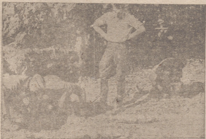
Después de cada ataque inglés se coleccionan en Alemania y en las zonas ocupadas los numerosos obuses no explotados. Las industrias plutocráticas entregan pues, a su Patria, un material que deja mucho que desear

OBRAS PUBLICAS. —Orden por la que se exige expresar el nombre del consignatario y la estación de destino al hacer las facturaciones.—Cifra.