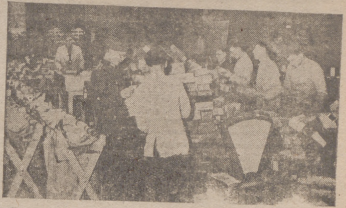
Los grandes trabajos del Correo militar de Alemania.— Envío de pequeños paquetes para los soldados