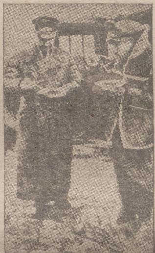
Después de un vuelo de guerra, el «as» de la aviación alemana, Galland, saborea un plato de comida

Teniendo en cuenta que una hembra de salmón de tamaño medio es capaz de poner de diez a doce mil huevos, se espera que en el plazo de cinco o seis años nuestros ríos norteños vuelvan a tener la misma riqueza que antes de la guerra, lo que servirá de base para una repoblación más a fondo.