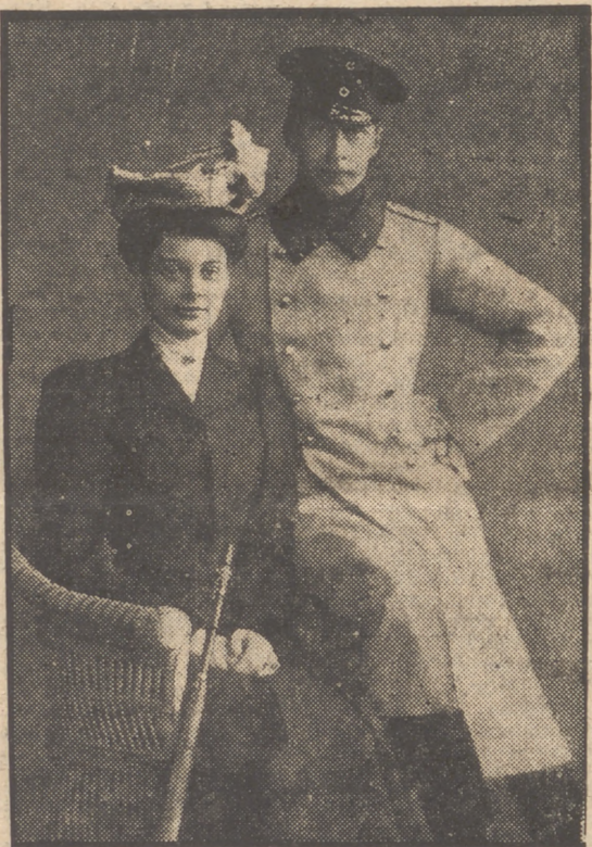
El matrimonio heredero del Trono imperial alemán. El Kronprinz Guillermo y su esposa, la princesa Cecilia de Mecklemburgo, posaban así ante los fotógrafos poco tiempo después de su boda.

to Groha saltó inmediatamente al primer plano de la actualidad. «Un desconocido, heredero y depositario de los más importantes secretos de los Hohenzollern», anunciaron escandalosamente los periódicos. Y su biografía, extra-