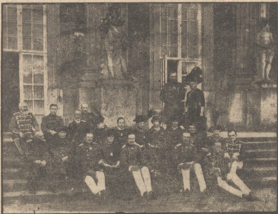
La familia imperial de los Hohenzollern, presidida por el Káiser Guillermo y su esposa, la emperatriz Augusta Victoria. En el numeroso grupo de príncipes falta precisamente el Kronprinz. Pero entonces se hablaba de la «ausencia significativa» de éste, motivada por ciertas diferencias con su padre, el emperador. Eran los tiempos todavía felices para los Hohenzollern, de 1914...