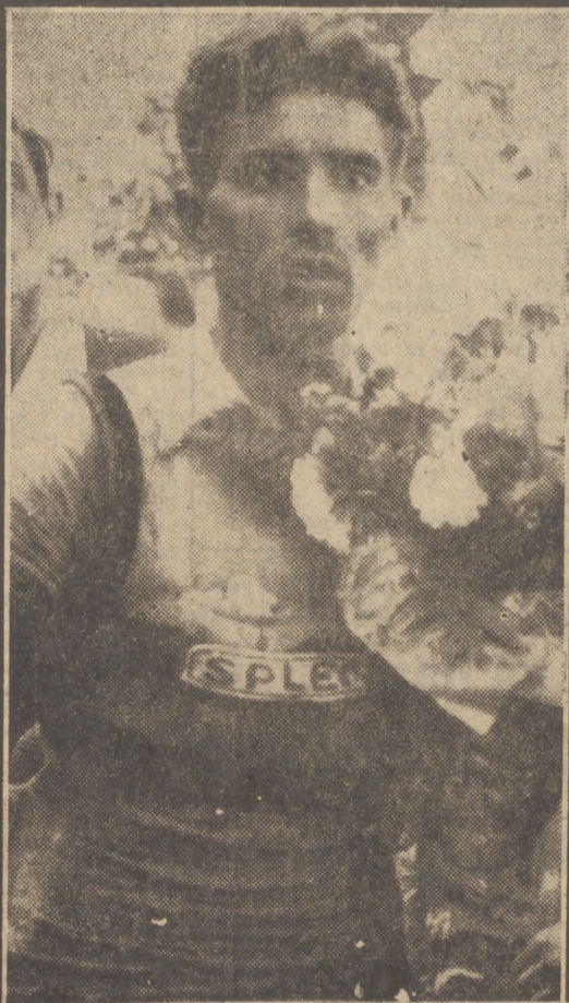
«El Aguila» de Toledo