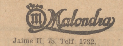
Jaime II, 78. Telf. 1732.